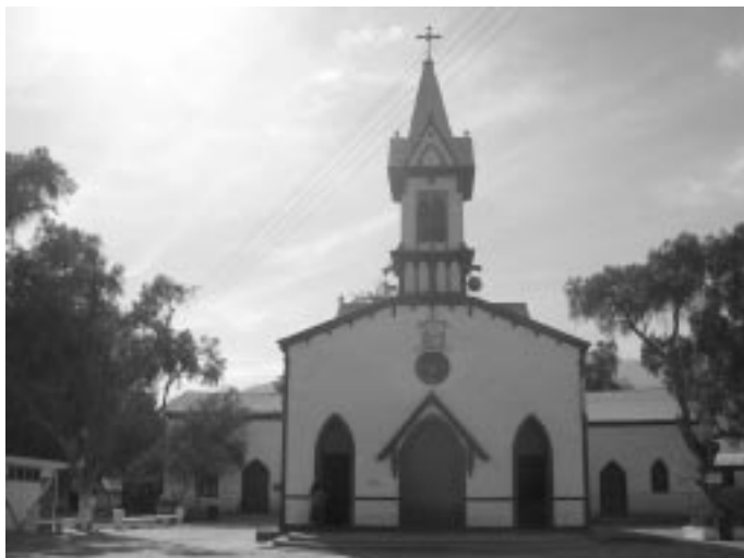
Santuario de La Candelaria en Copiapó.

En la Parroquia de La Candelaria de la comuna se conserva una de las primeras imágenes traídas por los españoles hasta las australes tierras de Chile hace 400 años.