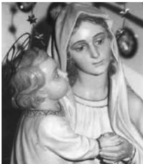
Nuestra Señora del Divino Llanto