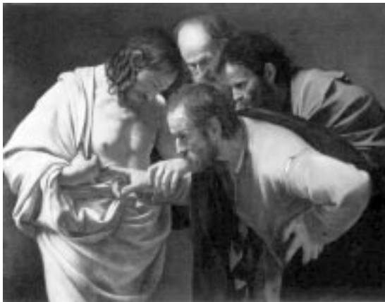
Dice Jesús a Tomás: “Has creído porque me has visto... Dichosos los que, aun no viendo, creen”.

San Lucas narra que cuando las mujeres anunciaron esta buena nueva a los apóstoles, ellos pensaron que decían desatinos y no les creyeron. Sin embargo, durante aquel día y los siguientes, las apariciones y las visiones propiciaron que todo el grupo que había seguido