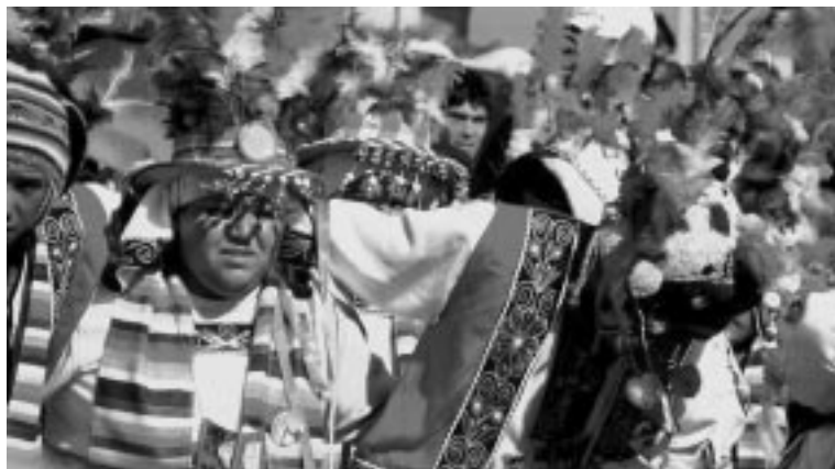
Baile Tinku en las festividades de La Candelaria en Copiapó.

En las costas de la región del Biobío se celebra en varias comunidades ubicadas en la región. En la comuna de Cobquecura se conmemora en la Iglesia de la Piedra, donde se