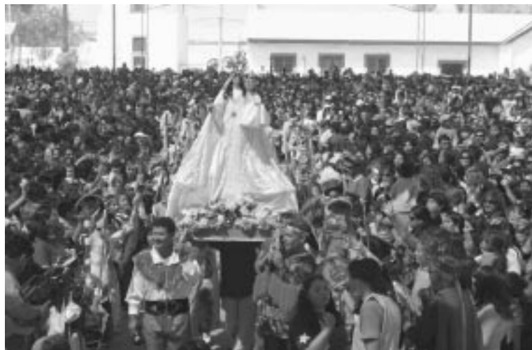
Procesión de La Candelaria por las calles Copiapó.

desarrollan a la par varias actividades propias del campo chileno: correduras de rodeo, domaduras y fiestas huasas.