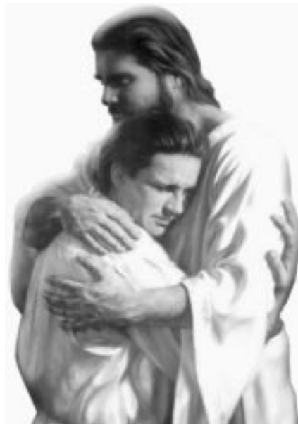
Dice Jesús: "Bienvenido, amigo mío. La paz y la alegría sean contigo..."

—Maestro mío, esperaré y creeré siempre de hoy en adelante. No dudaré más, jamás, Señor. Viviré de fe. Me has dado la capacidad de creer en lo increíble.