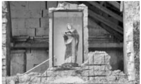
Imagen indemne en la iglesia de Bohol

Con menos de un mes de intervalo, dos enormes calamidades se abatieron sobre las Filipinas, país muy poblado de mayoría católica. El país es un gran archipiélago expuesto a fenómenos sísmicos y huracanes de rara intensidad. El día 16 de octubre, un terremoto de magnitud 7.2 alcanzó especialmente a la isla de Bohol, dañando severamente grandes y sólidas iglesias coloniales con hasta 400 años de antigüedad. La segunda gran calamidad fue provocada por el tifón Haiyan (denominado allí Yolanda) el 8 de noviembre, y que causó cerca de 2500 muertes. En las dos inmensas tragedias se registró el mismo fenómeno: imágenes de Nuestra Señora y del Sagrado Corazón de Jesús resultaron inexplicablemente indemnes. Por ejemplo, la imagen pintada en una iglesia de Bohol: todo el muro de la iglesia se desplomó, pero el lugar donde se encontraba la imagen quedó en pie. En el mismo terremoto, informa la televisión filipina, diversas imágenes, sobre todo de nuestra Señora de Lourdes, fueron salvadas de modo inexplicable. “Es un milagro”, decía Carol Ann Balansag, del periódico Inquirer News , señalando la imagen patronal de la iglesia de Santa Cruz, del siglo XVIII, en Barangay, provincia de Bohol. Entre las ruinas de la iglesia de Nuestra Señora de la Luz, en la ciudad de Loon, en la misma provincia, los