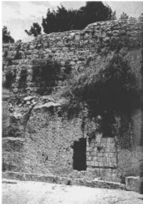
Algunos cristianos creen que el sepulcro de Jesús pudo haber sido esta cueva situada al norte de la antigua muralla de Jerusalén. Fue descubierta en 1867

José de Arimatea, hombre rico que en secreto había sido seguidor de Jesús, obtuvo de Pilato el permiso para sepultar el cuerpo. José, miembro del Sanedrín y que, según San Lucas (23, 51), “no había aprobado ni la resolución ni los actos de los demás”, tenía un sepulcro de piedra sin utilizar en un huerto cercano al Gólgota. Según San Juan, Nicodemo, fariseo sensato que también en secreto había conversado con Jesús, acompañó a José. Algunas seguidoras y parientas que habían permanecido al pie de la cruz pudieron haberse unido a ellos para ayudar a envolver el cuerpo en lino y hierbas