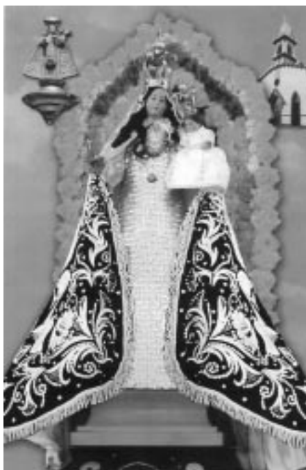
Virgen de La Candelaria, Copiapó-Chile

La capilla de La Candelaria, en la ciudad de Copiapó, donde residía la imagen, fue devastada por el terremoto de 1922, quedando sola-