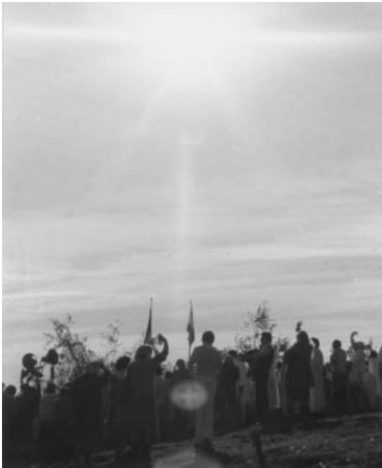
Peregrinos mirando el sol durante una de las apariciones de 1984.