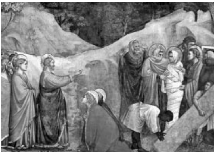
“Quitadle las vendas, y dejad que camine. Dadle vestidos y comida”.

Después Lázaro se dirige a sus hermanas a quienes besa, lo mismo hace con Maximino y