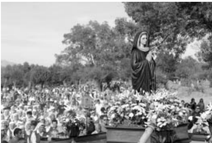
Miles de fieles acompañan en procesión a nuestra Señora Dolorosa de El Escorial, España

La conocí en El Escorial, en 1985, en la casa de la familia a la que sirve como doméstica para ganarse el pan, porque su marido no trabajaba y ella tenía que hacer lo imposible para sacar adelante a sus hijos. Es una mujer sencilla, sosegada, natural, que no se apasio-