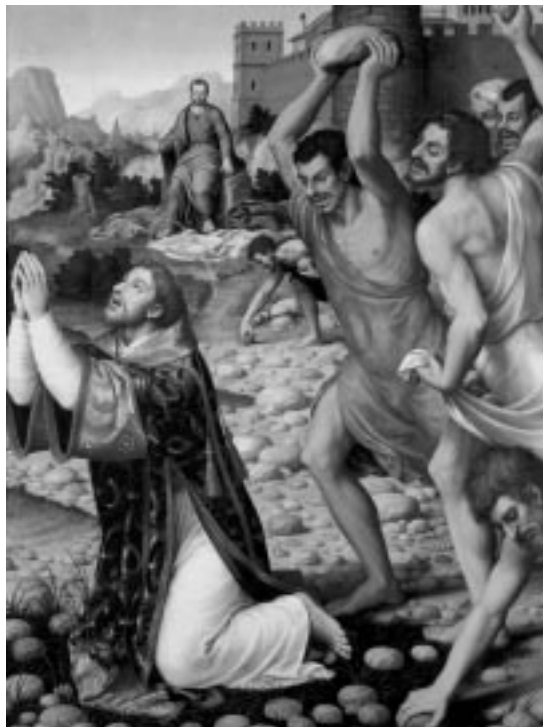
San Esteban es lapidado (Juan de Juanes 1510-1579)

“Estoy viendo los cielos abiertos y al Hijo del hombre que está de pie a la diestra de Dios”, continuó Esteban, y podría haber dicho más todavía, pero sus oyentes “gritaron fuertemente, se taparon los oídos y se precipitaron