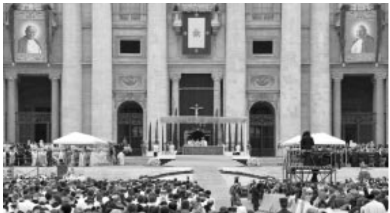
Dos enormes lienzos con los retratos de Juan Pablo II y Juan XXIII presidieron la ceremonia de canonización

En su homilía, Francisco definió a Juan Pablo II, quien lideró a los católicos desde 1978 hasta su muerte en 2005, como “el Papa de la familia”, mientras que a Roncalli lo calificó de un “pastor, un guía-guiado”.