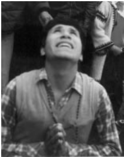
Miguel Ángel de rodillas en éxtasis

La estoy inventando recién. Es que no me sale la melodía de repente, le comenta a Nuestra Señora.