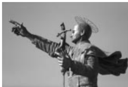
Vista de la nueva estatua del fallecido papa Juan Pablo II, inaugurada en Santiago de Chile el día de su canonización, el 27 de abril de 2014.

La plaza Juan Pablo II, ubicada en el barrio Bajos de Mena, uno de los más