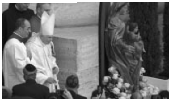
El Papa Emérito Benedicto XVI llega a la ceremonia de Canonización de Juan Pablo II y Juan XXIII

“Que Juan Pablo II fuera un santo, en los años de la colaboración con él me ha sido continuamente cada vez más claro. Hay que