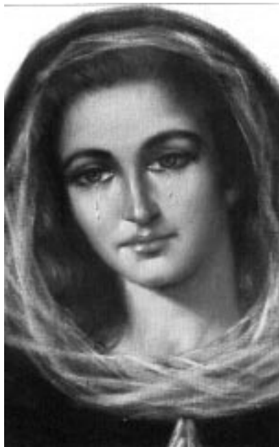
Nuestra Señora Dolorosa de El Escorial