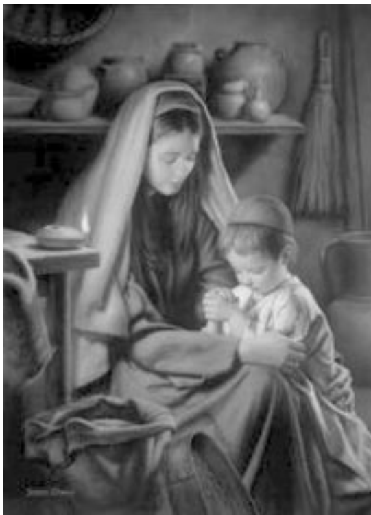
Yo Myriam, habría de tener muchos nombres: Nuestra Señora de Fátima, Virgen del Pilar...

El espíritu escucha, capta, envía y recibe. Es necesario que vosotros sepáis usar el espíritu. Tú cuando piensas, llamas, escuchas y eres escuchada. Es un regalo grande para ti y para muchos. Sabes usar el espíritu. No es fruto de la voluntad propia usar el espíritu, sino de la propia pureza.