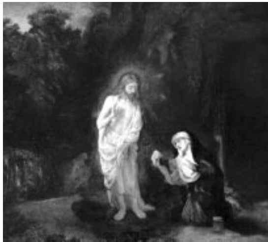
“Mujer, ¿por qué estás llorando? ¿A quién buscas?...”

—¡Me han quitado al Señor Jesús! Había venido para embalsamarlo con la esperanza de que resucitase... Todo mi valor, todas mis esperanzas, toda mi fe giraban en torno a mi amor por Él... pero ahora no lo encuentro más... He puesto aun mi amor alrededor de mi