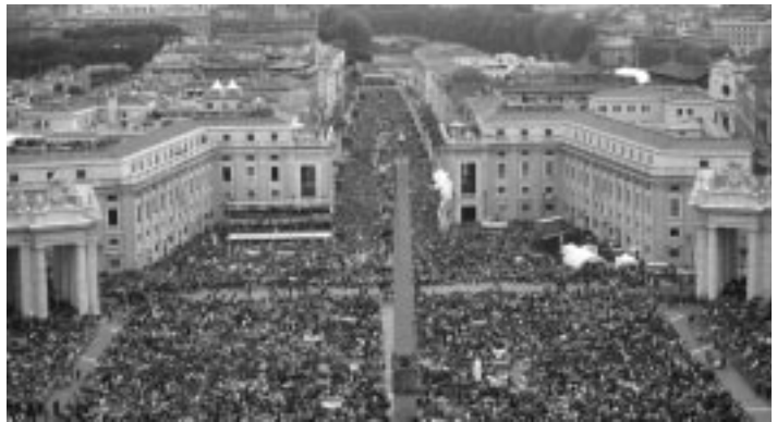
Más de un millón de fieles se reunieron en la plaza de San Pedro y alrededores para la ceremonia de canonización

Pero, además del polaco, fue el español la lengua que más se escuchaba en la plaza. Porque en la mañana de la canonización San Pedro, especialmente antes de la ceremonia, fue un lugar bullicioso. El recogimiento de quienes rezaban arrodillados no parecía interrumpirse por los cantos. “Esta es la juventud