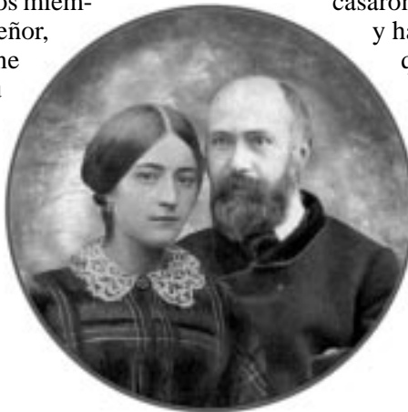
Luis y Zelia Martín, padres de Santa Teresita del Niño Jesús