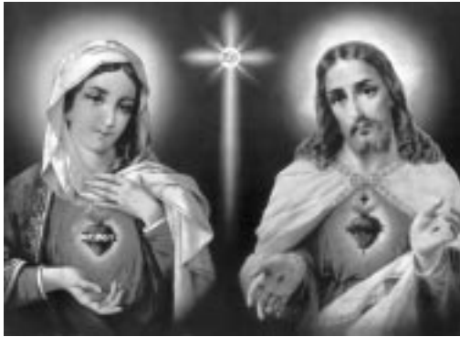
Sagrados Corazones de Jesús y María

Es en ese Corazón, en ese Abismo de gracia que Yo ejercí Mi Poder. El Autor del cielo y de la tierra, el Autor de la gracia, encontró Su cielo en el cielo, Su gracia en la gracia, para