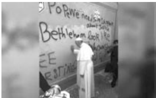
El Papa ora ante el muro que divide Israel de Palestina

nas pueden celebrar y orar en los lugares santos y lo hacen —y lo han hecho siempre hasta ahora— pero separadamente, según los horarios y lugares destinados a las diversas comunidades. Esta es la primera vez que celebran juntos. Después de este encuentro verdaderamente histórico, el Papa y el Patriarca, en un mismo vehículo se dirigieron al Patriarcado Latino para la cena.