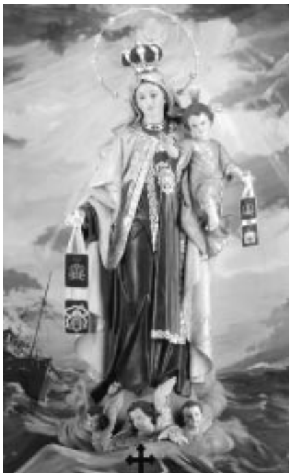
Virgen del Carmen