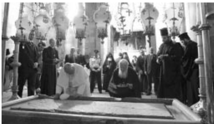
Francisco y Bartolomé I oran ante la tumba de Jesús en la Iglesia del Santo Sepulcro

Bartolomé I y el Papa Francisco bajaron juntos a la tumba de Jesús para orar, delante de la piedra, donde se dice que estuvo el cuerpo de Jesús después de su muerte. Luego se dirigieron al Calvario en el Monte Gólgota, acompañados por tres representantes de las más importantes comunidades. Se puede considerar extraordinaria esta celebración conjunta en este lugar santo de Jerusalén, algo que no había ha sido presenciado jamás y se produce diez siglos después del cisma. Las comunidades cristia-