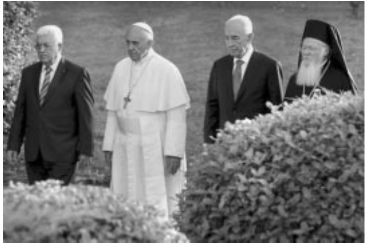
Los Presidentes de Palestina y de Israel, Mahmoud Abbas y Shimon Peres, el Papa Francisco y el Patriarca Bartolomé I en los jardines de la residencia de Santa Marta en El Vaticano

“Recemos por ellos y por la paz en Tierra Santa y en todo Medio Oriente”, exhortó el Papa, en cuya audiencia agradeció la acogida que Jordania da a los refugiados, así como su