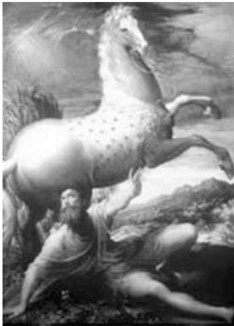
“¿Quién eres, Señor?”

Había sufrido un total trastrueque en la intención, mas no en el carácter. En su posterior descripción de lo que le sucedió hablaría de su revelación como los viejos profetas habían hablado de su propia vocación, llamándose a sí mismo “apóstol de Cristo Jesús por voluntad de Dios”. No había perdido nada de su irrestricto deseo de servir a Dios, pero su idea de lo que ello significaba había cambiado por completo. En vez de tender a preservar la exclusividad de las tradiciones de las que tan devoto había sido, a partir de entonces y por el resto de su vida buscaría salir de su círculo y aglutinar a toda la humanidad, a judíos y a gentiles por igual, en una sola comunidad de creyentes. Nunca volvió atrás la