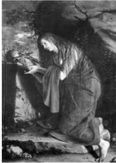
María Magdalena en penitencia y sacrificio

—Se me va la Vida, Maestro mío, y ¿habré de morir sin volver a verte? ¿Cuándo podré gozar de tu vista? Mis pecados están delante de