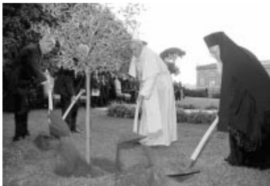
Los Presidentes de Israel y de Palestina, Shimon Peres y Mahmud Abbas, el Papa Francisco y el Patriarca Bartolomé I plantan un olivo en los jardines de su residencia de Santa Marta en El Vaticano

El encuentro, celebrado a invitación de Francisco, ha despertado expectativas sobre un nuevo impulso al proceso de paz palestino-israelí, pero fuentes del Vaticano han querido enfriar estas esperanzas tras calificarlo de “pau-sa en la política”, según fuentes citadas por la agencia de noticias Reuters.