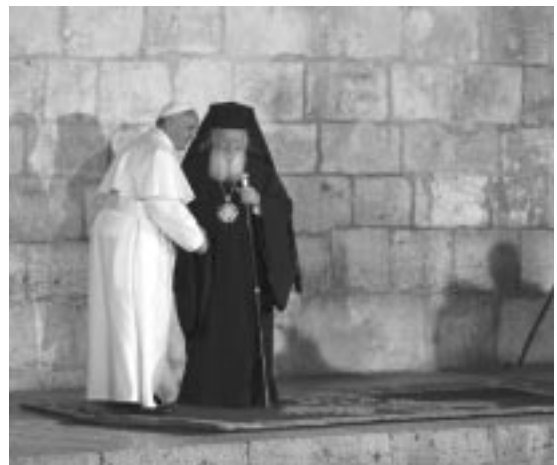
Francisco se reúne con Bartolomé I

Después el Papa continuó a Betania, mas allá del Jordán, el lugar del Bautismo de Jesús y bendijo las aguas, como lo había hecho Pablo VI. Para poder descender por las escalinatas, debió ser ayudado por un sacerdote