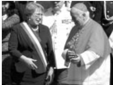
La Presidenta Michelle Bachelet y el Cardenal Ricardo Ezzati

Las palabras del Cardenal Ezzati hacen referencia a que, en su discurso a la Nación en el Congreso, al tiempo que ha anunciado su decisión de impulsar la legalización del aborto