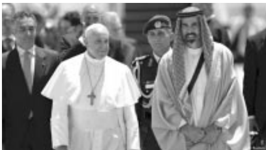
El Papa Francisco es recibido en Jordania

La visita del Papa Francisco a Israel fue presidida anteriormente por los viajes de los