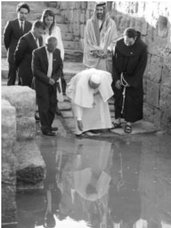
Francisco bendice las aguas del Jordán; lo acompañan los Reyes de Jordania y comitiva

entre el 24 al 26 de mayo. Las etapas fundamentales de este viaje fueron Jordania (Amman y Betania), el estado de Palestina (Belén) y después Jerusalén. Tres estados, tres etapas fundamentales, tres días.