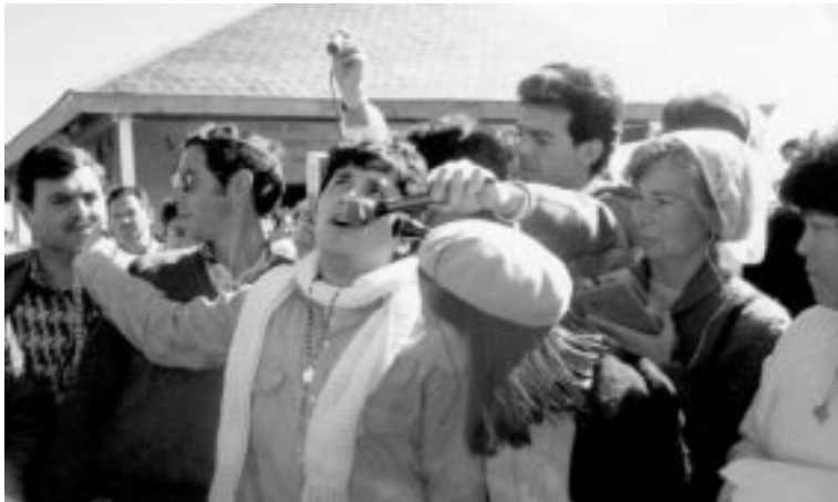
Miguel Ángel en éxtasis durante una aparición en el Santuario

Es de una claridad extraordinaria, en cuanto a lo que le espera al mundo, al Papa y con él a la Iglesia Católica. Nos dice la Santísima Virgen, que todos sus anuncios de catástrofes no son nada comparado a la gravedad de lo que nos ha revelado por intermedio de Miguel Ángel. Peor que la guerra, es la pérdida de la Fe y la lucha por restaurarla.