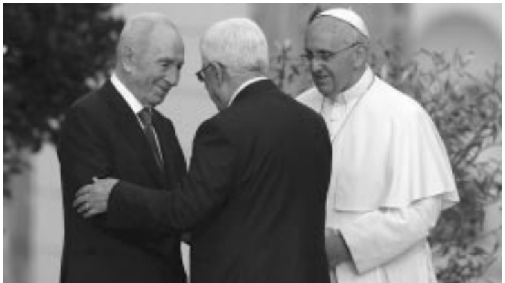
Los Presidentes de Israel, Shimon Peres, y de Palestina, Mahmud Abbas se saludan frente al Papa Francisco en su residencia de Santa Marta en El Vaticano

El Papa ha recibido a los dos dirigentes frente al edificio en el que se encuentra su modesta residencia elegida por Francisco tras su elección en lugar de los fastuosos Palacios Pontificios. Abbas y Peres han llegado juntos en un minibus.