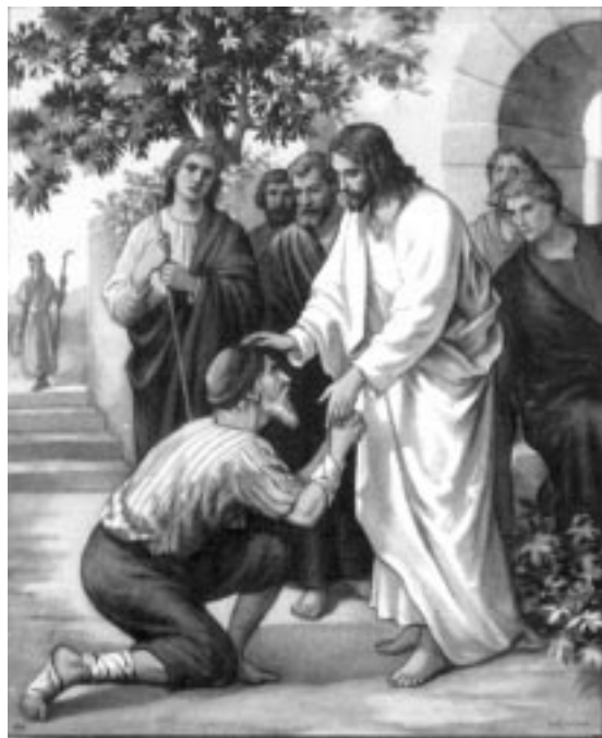
Jesús cura leproso

La gente grita de estupor. El hombre al oír los gritos de júbilo comprende que ha sido curado. Levanta las manos, que hasta ahora la hierba había escondido, se toca el ojo, allí donde estaba el enorme agujero; se toca la cabeza, allí donde estaba la gran llaga que dejaba al descubierto el cráneo, y siente la nueva piel. Se yergue y se mira el pecho, las piernas... Todo está sano y limpio. El hombre se deja caer en medio de la hierba en flor llorando de alegría.