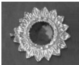
Foto de la hostia consagrada

“Mientras esto ocurre, la Iglesia de Guadalajara, a través de su Arzobispo Cardenal ha indicado que no se exponga a la mirada del