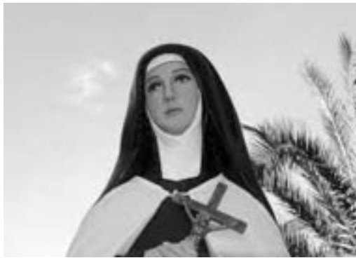
Santa Teresa de Los Andes

“No podía sola, sin saber que toda mi familia estaba en lo mismo. Sentía que sólo en la oración estaba el alivio de mi niña y sumergida en la fe, recé la oración de Teresita, y le