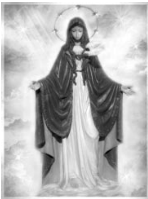
Santa María del Espíritu Santo

Después de cumplir los 16 años, siendo el día 21 de julio de 1999 a las 7 de la mañana,