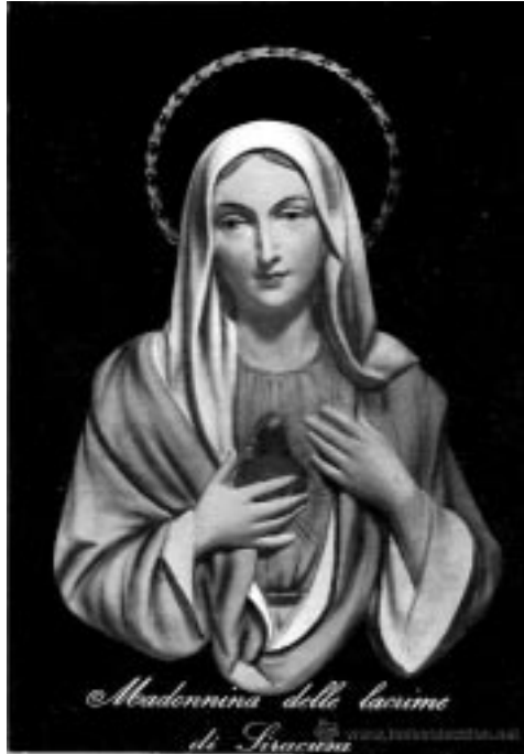
Nuestra Señora de las Lágrimas de Siracusa