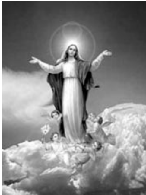
Nuestra Señora de la Asunción

Madre a Hijo, va más allá de todo lo que en algunos santos ha obrado Dios. Por eso Ella misma dice que “el Poderoso ha hecho obras grandes en Mí”; y por eso Isabel le dice “Bienaventurada entre todas las mujeres”. Y en esta mujer, Dios no ha querido solamente que su cuerpo quedara incorrupto, sino que ha querido que fuera llevado al cielo. Como una manifestación especial y única de su grandeza; de la grandeza de los dones que Ella recibió de Dios y de la grandeza con que Ella respondió a la predilección de Dios.