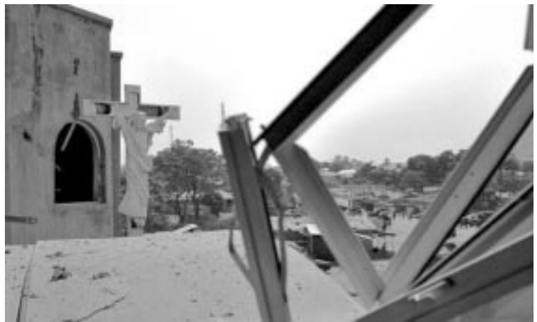
Escombros de una Iglesia destruida producto de atentados

Al reflexionar sobre el Evangelio de San Lucas, en el que Jesús habla de las pruebas y tribulaciones que precederán a los tiempos finales, el Santo Padre explicó que cuando el Señor se refiere a esto en el pasaje, “ nos dice que lo habrá de ser una profanación del templo ”. Será “ una profanación de la fe, de la gente ”, continuó, y “ va a ser una abominación, será una desolación y una abominación. ” “ ¿Qué quiere decir esto ”, el Papa preguntó a los asistentes a la Misa. Su respuesta,