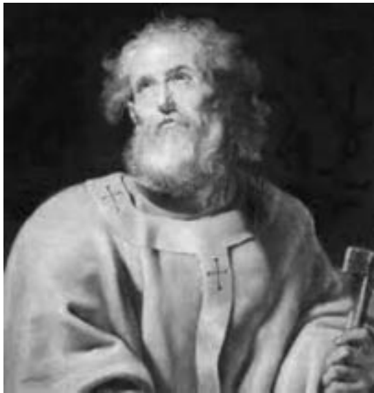
Apóstol San Pedro

Cornelio había reunido a un grupo de amigos que compartían tales inquietudes y pidió a Pedro que les dijera “todo lo que te ha sido ordenado por el Señor”. Pedro narró la historia de Jesús y concluyó diciendo que “todo el que cree en Él alcanza, por su nombre, el perdón de los pecados”. Mientras Pedro hablaba, relatan los Hechos (10, 44), “el Espíritu Santo cayó sobre todos los que escuchaban la Palabra”. El grupo empezó a hablar en lenguas (es decir, en