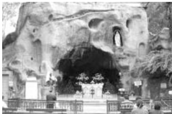
Santuario de Lourdes, Santiago

cias a que las puertas de la Basílica son de metal se evitó un daño mayor, pues podría haberse producido un incendio. A pesar de esto los costos de reparación serán altos y además tomarán un tiempo largo, ya que el clima dificulta las reparaciones.