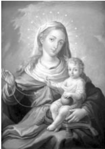
Nuestra Señora del Rosario

Fuentes: Integrated Catholic Life, La Oración, Signos de estos Tiempos forosdelavirgen.org