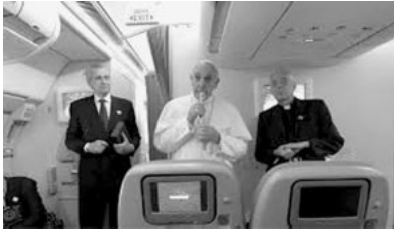
El Santo Padre responde a las preguntas durante la Rueda de Prensa en el aire

Frank Rocca, responsable de la Agencia Católica de información de los Obispos estadounidenses preguntó al Papa Francisco: Usted se ha referido, con palabras muy duras contra el abuso sexual de menores por parte del clero, de sacerdotes. Y ha creado una comisión especial para afrontar mejor este problema desde la Iglesia universal. En senti-