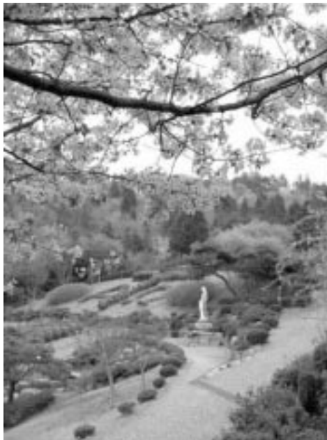
Santuario de Naju, Corea