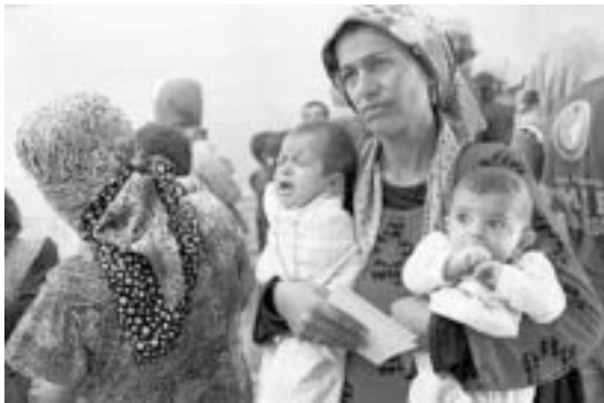
Madre cristiana con sus hijos en brazos huye de los extremistas del Estado Islámico

licía de la ciudad de Mosul, de la que se vio obligado a huir cuando la tomaron los combatientes del Estado Islámico.