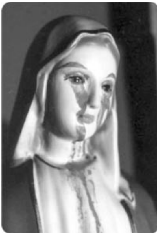
Imagen de la Santísima Virgen que ha llorado lágrimas y lágrimas de sangre en repetidas veces en la pequeña localidad de Naju, Corea del Sur.

Durante los siglos XVIII y XIX casi veinte mil católicos fueron martirizados en Corea, un