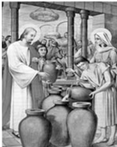
Jesús, a pedido de su Madre, la Santísima Virgen transforma el agua en vino, en las bodas de Caná.

No temas, soy Yo, Myriam quien dicta a tu espíritu y hace escribir a tu mano. En Caná, Jesús hizo aquel milagro por Mí, aunque no había llegado todavía la hora de los milagros visibles ¿Vino o fe? El vino significa la fe, los milagros son siempre para el espíritu. También estas palabras son para el espíritu y son milagros y por tanto o se creen o se dejan de creer. Quien sabe ver a Dios ve Su mano, quien no cree, nada ve. Habíamos ido allá para la boda