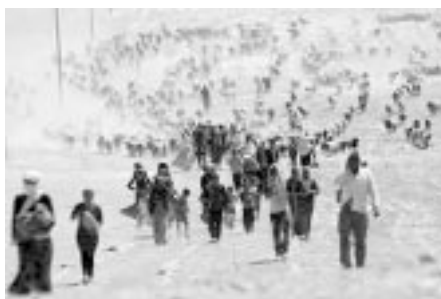
Centenares de miles de personas se desplazan en el desierto huyendo de Irak

No tenemos mucho tiempo. Es cuestión de semanas. Nosotros ya tenemos preparados diversos planes de evacuación. Todo el personal