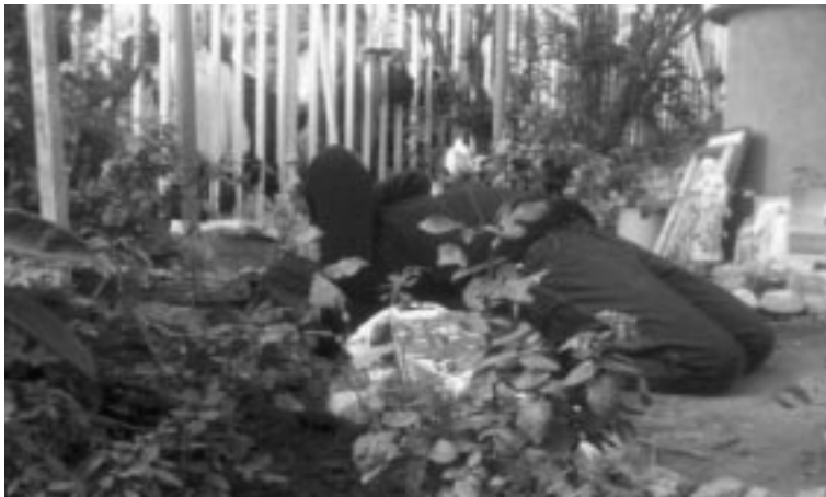
Miguel Ángel en éxtasis doblando su cuerpo totalmente hacia atrás

DEL CRISTO VIVIENTE Y REINANTE PARA TODOS LOS SIGLOS, EL QUE VA A VENIR A JUZGAR A LOS VIVOS Y A LOS MUERTOS, EL REY DE REYES, MI HIJO, EL BUEN PASTOR.