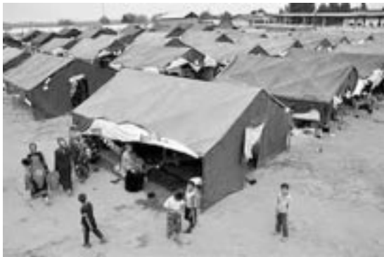
Campamento de refugiados en Erbil

occidental sabe que es objetivo principal de las milicias del IS. Nuestra captura puede ser utilizada tanto para la obtención de un rescate o como propaganda suya para mostrar cómo se realiza el exterminio de infieles. Sabemos que tienen informadores y terroristas dentro de la ciudad . Mi intención es permanecer en Erbil hasta el último momento. Pero sé que cuando me vaya, detrás de mí siempre quedarán los niños.