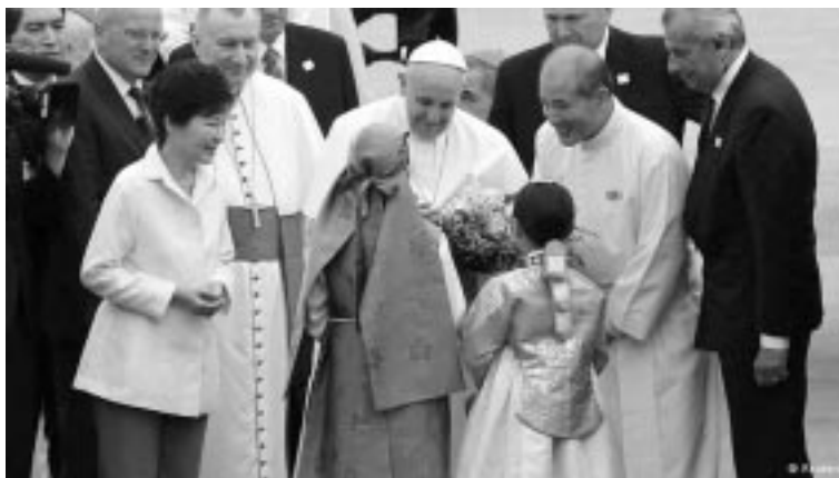
Papa Francisco recibe flores de dos niños coreanos durante su visita a Corea del Sur. Lo acompaña la Presidenta, Park Geun-hye

Francesca Paltracca: Para el Papa venido