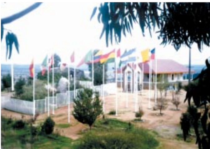
Vista del sector de las banderas, la Capilla, el jardín rodeado por la reja, la ermita de la Virgen de Fátima y la Gruta de Lourdes.