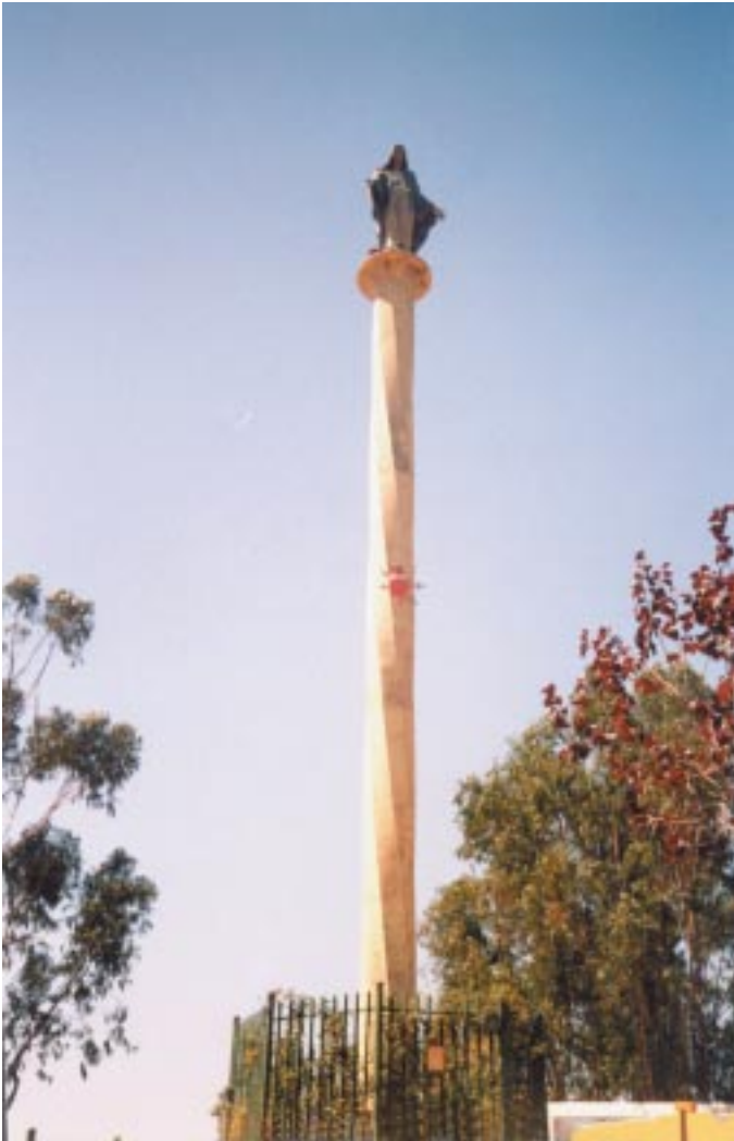
Columna con la imagen de la Dama Blanca de la Paz.