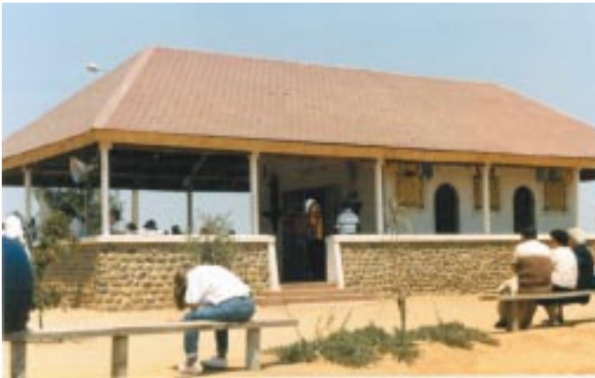
Capilla del Santuario recién terminada (diciembre 1984).

En el atrio de la Capilla se observa la Imagen de la Virgen de Los Rayos que se apareció a Catalina Labouré.