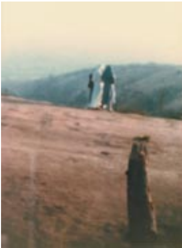
Fotografía de Carlos Caballería a dos religiosas que bajaban del cerro y donde aparece una tercera.

cuerdo a las instrucciones de la Municipalidad. Pero con la ayuda de varios creyentes fue posible hacerlo. Pero mientras llegaba ese momento las Apariciones continuaron en el lugar sin problema.