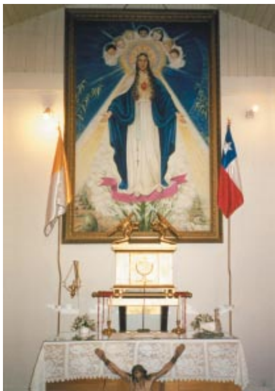
Cuadro de la Dama Blanca de la Paz, Sagrario e imagen de Jesús Crucificado en el altar de la Capilla.

situación estaba difícil con Argentina, pidió se colocaran la bandera Papal y la Argentina a los costados del altar y que rezáramos por la Paz.