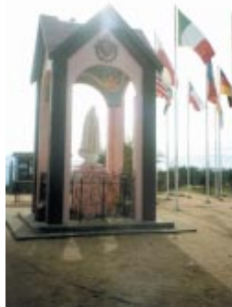
Ermita de la Virgen de Fátima.

Detrás de la Ermita de la Virgen de Fátima se pueden observar 19 mástiles donde en los días de celebraciones se colocan diferentes banderas. Hay numerosos países. La misma Santísima Virgen las fue pidiendo y que consagraran esos países a Su Corazón Inmaculado. Esta ha sido una de los mayores pedidos de Nuestra Madre, que los países se consagren a Su Corazón y así protegerlos. Cuando la