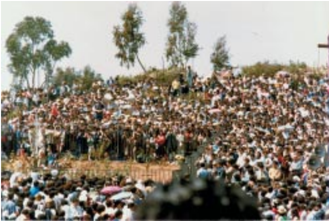
Multitud de fieles rodean el lugar del futuro jardín durante la Aparición del 7 de octubre de 1983.

estar muy firmes en la fe. La segunda respuesta que recibió y que la contó poco después, fue, que al preguntarle quien era Ella, dijo lo siguiente: “SOY EL CORAZÓN INMACULADO DE LA ENCARNACIÓN DEL HIJO DE DIOS”.