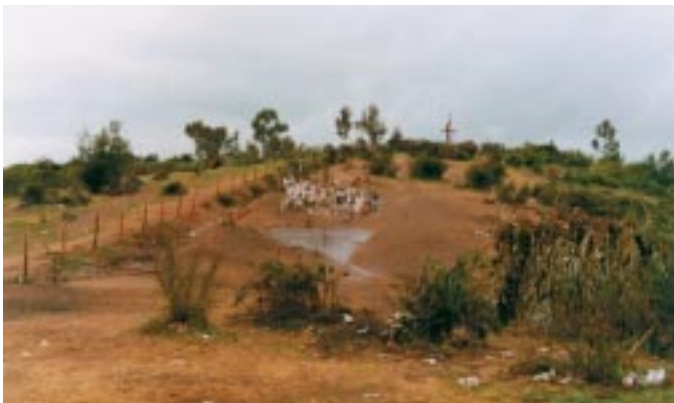
El lugar de las Apariciones al inicio de éstas (fotografía del 14 de septiembre de 1983)