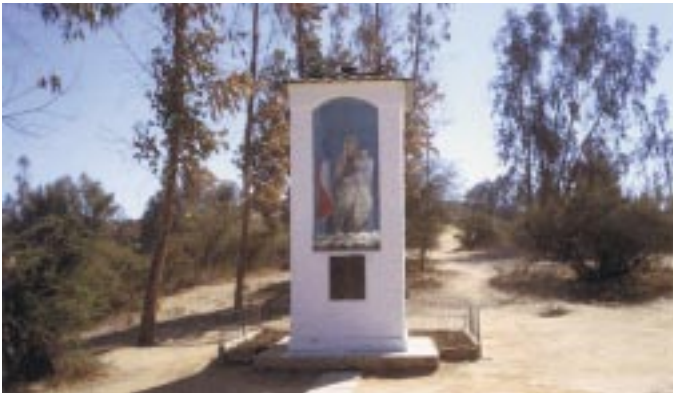
Ermita de la Virgen del Carmen en la entrada del Santuario.

expresiva nos ayuda a meditar en la Pasión de Nuestro Señor. Al terminar el Vía Crucis está la ermita de Jesús de la Misericordia y al lado la Cruz de Dozule. (Esta Aparición se realizó en Francia, donde Nuestro Señor solicitó que colocaran cruces en varios lugares preparando Su venida a la tierra)