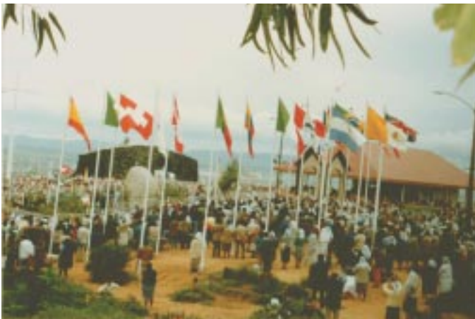
Sector de las banderas con sus 19 mástiles en un día de peregrinación.

Bajo los pies del Sagrado Corazón está el escudo de Israel. Curiosamente la Santísima Virgen ha unido varias veces a Chile con Israel.