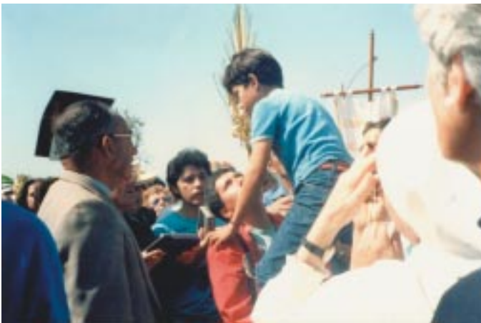
El vidente levanta un niño sin esfuerzo aparente para ser bendecido.