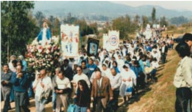
Procesión con el anda de la Virgen subiendo el cerro.

mundo. Dios va a herir de un modo como no hay ejemplo".