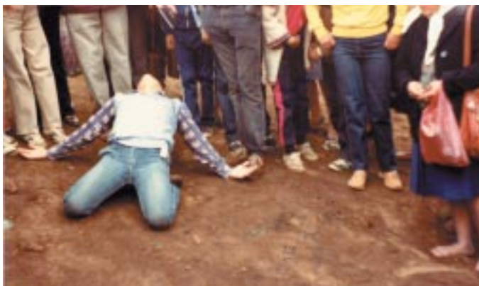
Miguel Ángel en éxtasis de rodillas y echado hacia atrás (24-X-1983).