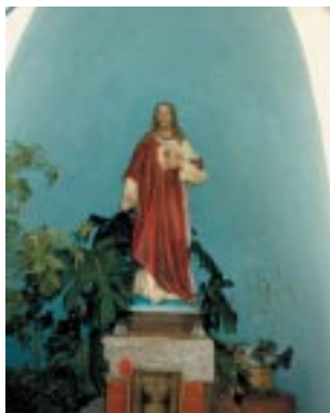
Gruta Sagrado Corazón en el jardín.

de Paraíso como lo llama la Santísima Virgen, rodeado por la reja y donde normalmente se aparecía, hay una gruta con la Imagen del Sagrado Corazón. Primeramente se colocó una escultura de la Dama Blanca de la Paz. Pero luego a petición de Ella misma, se cambió por una Imagen del Sagrado Corazón. La Santísima Virgen explicó: “Debes colocar el Sagrado Corazón de Jesús” . Al responderle el vidente que la gente se podía enojar le respondió: “Yo he venido a preparar el camino de Mi Hijo, para Su Segunda Venida” . Di estas palabras: “Yo he venido a preparar este lugar para Nuestro Señor, así como lo hago en Chile” .