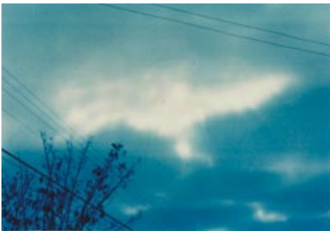
Fotografía tomada al cielo de Peñablanca sobre el Santuario donde se aprecia claramente una nube con la forma de una paloma (Espíritu Santo).

Así se trataba de poner en duda cada suceso extraor-