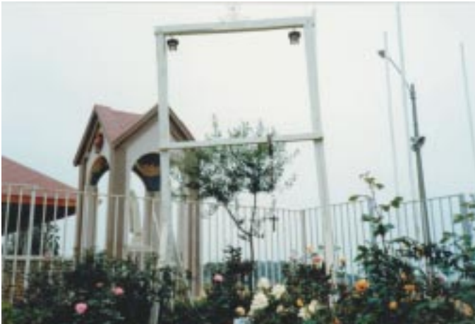
Arco, olivo (obsérvese tamaño) y rosas en tiempo de las Apariciones.

cimiento que sienten hacia la Santa Virgen, la Dama Blanca de la Paz, y continuamente le suben flores y velas para demostrarle su amor, especialmente tratan de cumplir con un insistente pedido de Nuestra Madre, el rezo del Santo Rosario. También muchas veces Ella pidió que fuéramos a acompañar al Santísimo en las “heladas” Iglesias pues está sólo y abandonado.