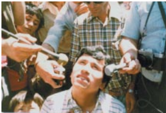
Miguel Ángel en éxtasis rodeado de periodistas (29-XII-1983).