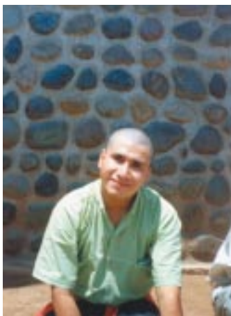
Miguel Ángel con el pelo cortado al rape.

Queremos dejar constancia que en todas las Apariciones la Santísima