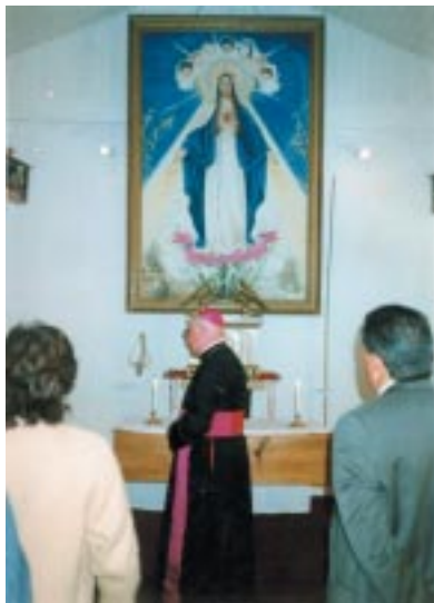
El Cardenal Jorge Medina Estévez recorre la Capilla del Monte Carmelo.

Pero, como decíamos anteriormente, tiempo después la Santa Misa fue autorizada para celebrarse los primeros sábados de cada mes. También suben sacerdotes a