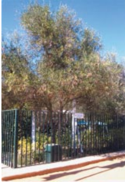
Jardín en la actualidad (obsérvese el arco prácticamente tapado por el olivo).

Pero lo que más precipitó la negativa de la iglesia, fue cuando la Santísima Virgen dio a conocer el mensaje en que anunciaba la infidelidad de muchos sacerdotes y los llamó “cloacas de impureza” . “Ese no es lenguaje de la Santísima Virgen” , decían. Pasados algunos años se ha demostrado que tristemente este anuncio era verdadero y que ya había sido dado anteriormente en las Apariciones de La Salette (aprobadas por la Iglesia) y que actualmente se ha escuchado en varias otras Apariciones.