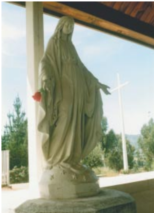
Imagen de la Virgen de los Rayos en el atrio de la Capilla y la Gran Cruz.

Varias veces Ella lo dijo: “Vengo a salvar almas que van camino de la perdición. No quiero que se pierda ninguno de mis hijos”.