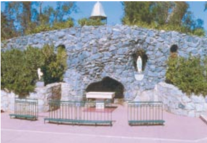
Aspecto actual de la representación de la Gruta de Lourdes.

de Paraíso como lo llama la Santísima Virgen, rodeado por la reja y donde normalmente se aparecía, hay una gruta con la Imagen del Sagrado Corazón. Primeramente se colocó una escultura de la Dama Blanca de la Paz. Pero luego a petición de Ella misma, se cambió por una Imagen del Sagrado Corazón. La Santísima Virgen explicó: “Debes colocar el Sagrado Corazón de Jesús” . Al responderle el vidente que la gente se podía enojar le respondió: “Yo he venido a preparar el camino de Mi Hijo, para Su Segunda Venida” . Di estas palabras: “Yo he venido a preparar este lugar para Nuestro Señor, así como lo hago en Chile” .