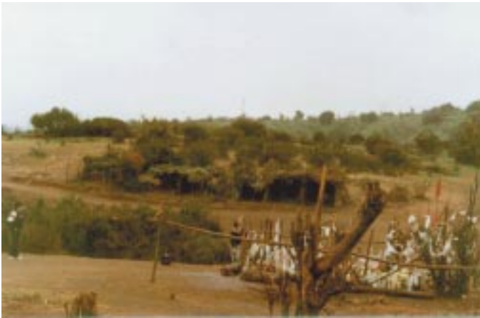
Rústico cierre del futuro jardín en el lugar de las Apariciones al inicio de éstas (fotografía del 14 de septiembre de 1983)

De pronto lo ven conversar con una persona que sólo él puede percibir y que más adelante le revela que es la Santísima Virgen.