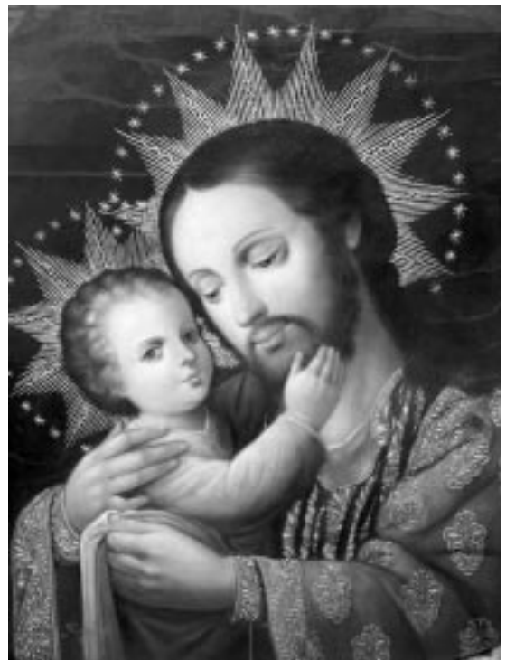
José y el Niño Jesús

José es el varón justo, cabal, perfecto, y como tal ha obrado en el momento trascendental de la Encarnación del Verbo, totalmente entregado a la voluntad de Dios con una fe ciega y absoluta en Él. Se desposa con María por voluntad de Dios. Es un matrimonio preparado por el Espíritu Santo, en el que sólo interviene Éste de una manera especialísima (Mt 1, 19a).