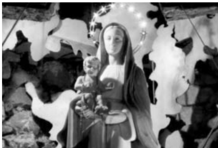
Imagen de la Virgen Reina del Castillo de Oliveto Citra, Italia

tos, los mensajes a primera vista parecen casi aburridos, dando la sensación de repetir las mismas cosas. No es sólo un sentimiento, sino que el autor legitimó este tipo de repetición (la Virgen), dice: “ Si no me canso nunca de repetir las mismas palabras, es porque sus corazones siguen siendo difíciles y no están abiertos a la aceptación de la gracia que Jesús les da con mi presencia entre ustedes ”, “ no se molesten si repito las mismas cosas, que hay que orar ”, “ no quiero ser repetitiva, pero debo hacerlo porque son pocos los que me escuchan ”.