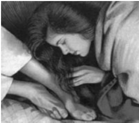
María cae de rodillas, besándole los pies.

—¿No te basta la fuerza de amor que tienes?