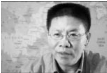
Li JF, juez católico perseguido en China

Li JF era un importante juez, pero católico. Tras ayudar a los pobres, el régimen chino le encerró en un campo de trabajo, le quitó su familia y sus bienes. Pero él doblegó a la dictadura. Revolucionó el campo de prisioneros con su fe.