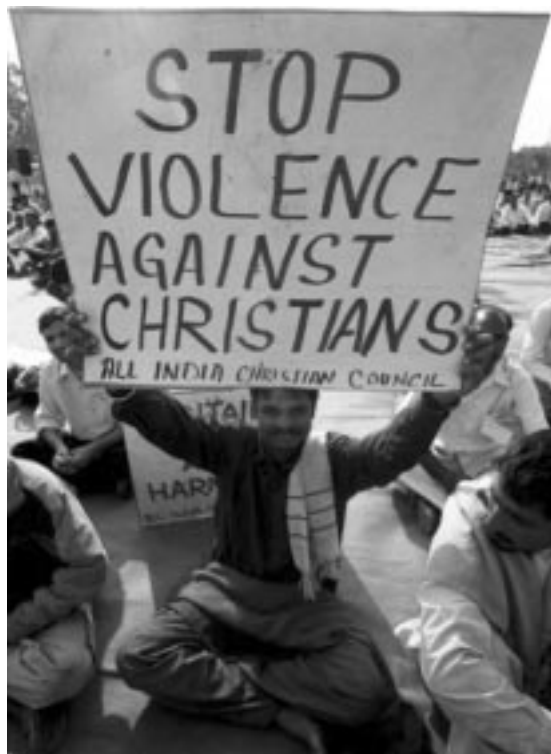
Manifestación pidiendo parar la violencia contra los cristianos en la India

Un informe sorprendentemente revelador es sobre Colombia. El Vaticano considera que ese país latinoamericano “ es el lugar más peligroso del mundo para ser un trabajador de la iglesia ”.