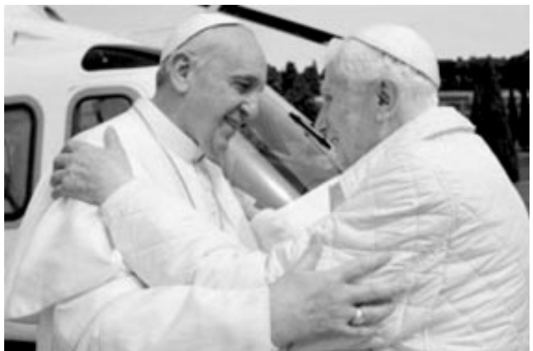
Histórico primer encuentro y abrazo entre dos Papas vivos. Benedicto XVI recibe a Francisco en el helipuerto de Castel Gandolfo.

Una cita diaria, por otra parte, se revelará un