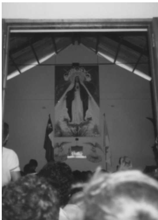
Interior Capilla del monte Carmelo de Peñablanca, altas y Sagrario