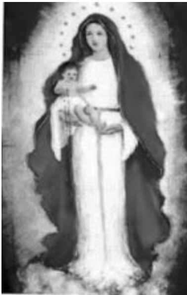
“Vieron una mujer joven, hermosa, con el niño en brazos, vestida de blanco ...”

De repente fueron atraídos por un constante y prolongado llanto de un niño. Algunos de ellos subieron las escaleras del castillo y entraron, no oyeron más el grito del niño y volvieron a jugar. Después de un tiempo se oyó de