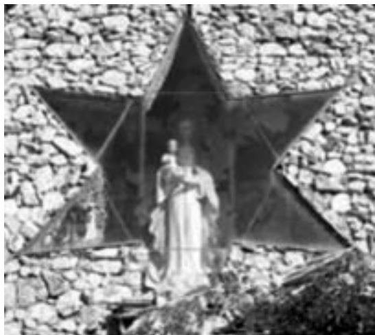
Detalle del Santuario al costado del castillo con la Virgen tal como fue vista

A preguntas de los videntes, la aparición