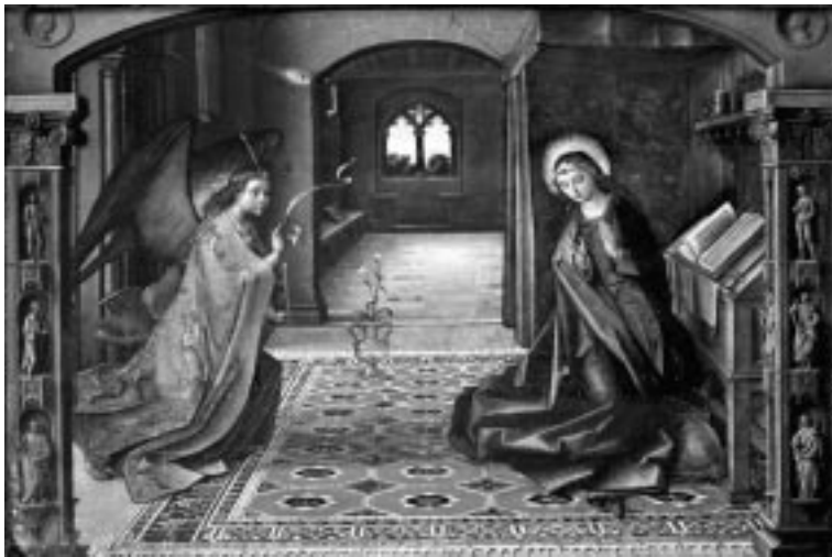
Dijo María: «He aquí la esclava del Señor; hágase en mí según su palabra»

misterio de María, toda su historia, su ser, y al mismo tiempo habla de la Iglesia, de su esencia para siempre; como también de cada creyente en Cristo, de cada alma cristiana llamada. En este punto debemos tener presente que no hablamos de personas del pasado. Dios, el Señor, nos ha llamado a cada uno de nosotros, cada uno es llamado por su nombre. Dios es tan grande que tiene tiempo para cada uno de nosotros, me conoce, nos conoce a cada uno por el nombre, personalmente. Es una llamada personal a cada uno de nosotros. Pienso que debemos meditar varias veces este misterio: Dios, el Señor, me ha llamado a mí, me llama, me conoce, espera mi respuesta como esperaba la respuesta de María, esperaba la respuesta de los Apóstoles. Dios me llama: este hecho debería hacernos estar atentos a la voz de Dios, atentos a su Palabra, a su llamada hacia mí, para responder, para realizar esta parte de la historia de la salvación para la que me ha llamado»