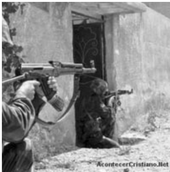
Soldados sirios luchan por recuperar Maalula tomada por un grupo de rebeldes vinculados a Al Qaeda

Los rebeldes sirios han negado que el ataque contra el poblado de Maalula haya sido sectario. Sin embargo, el poblador local aseguró a The Telegraph que los rebeldes, que se han replegado en las montañas desde marzo de este año, “han estado molestando a los cristianos del pueblo desde entonces”.