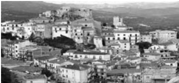
Castillo de Oliveto Citra, Italia

A partir de 1985 se comenzaron a dar una serie de apariciones de la Virgen que se iniciaron por 12 niños, en la puerta del Castillo de la plaza principal, y que prosiguieron con otros videntes. El acompañamiento pastoral del Párroco y el Arzobispo ha dado abundantes frutos.