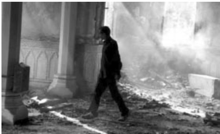
Desolador aspecto de una Iglesia destruida en El Cairo, Egipto

Y recalca que: “Hago mío el llamamiento del Papa Francisco para que se rece por la paz en Egipto. Sólo a través del diálogo y el respeto recíproco se podrá salir de esta trágica situación”. “Estoy llorando por toda esta humanidad sencilla, musulmanes y cristianos,