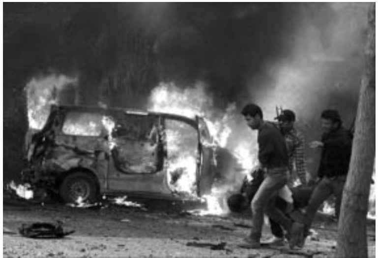
Socorristas retiran una víctima frente a los restos de auto bomba detonado en atentados contra Iglesias en Bagdad (Irak) en la Navidad

“Estoy seguro que, lamentablemente, son más numerosos hoy que en los primeros tiempos de la Iglesia ¡Son tantos! Esto sucede especialmente allí donde la libertad religiosa no es todavía garantizada o no es plenamente realizada. Quisiera pedirles, recemos hoy por estos her-