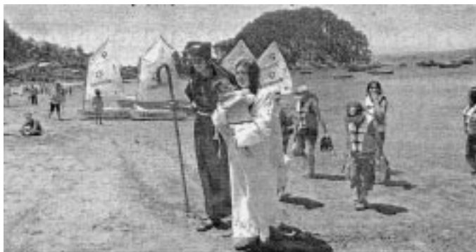
Representación. En el sector de Los Morros se realizó la “Navidad en el mar”, donde los pescadores de Coliumo (comuna de Tomé) representan un pesebre viviente. José, María y Jesús, llegaron desde el mar.