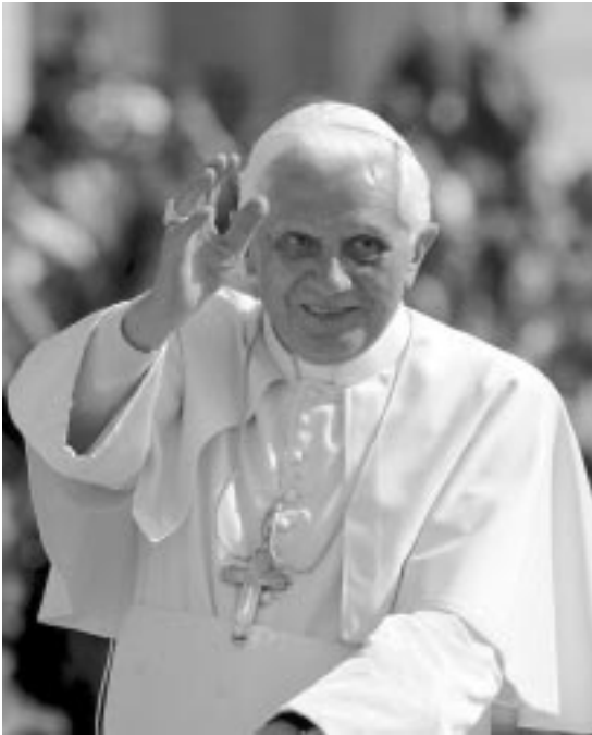
Papa Benedicto XVI

Los fieles que llenan la Plaza de San Pedro y los medios de comunicación de todo el mundo que emiten en directo no deberán esperar mucho el resultado: al día siguiente, después de apenas cinco votaciones, la fumata blanca anticipa lo que será proclamado solemnemente desde la Loggia de la Basílica Vaticana por el cardenal protodiácono Jean Louis Tauran: “¡Habemus Papam!” .