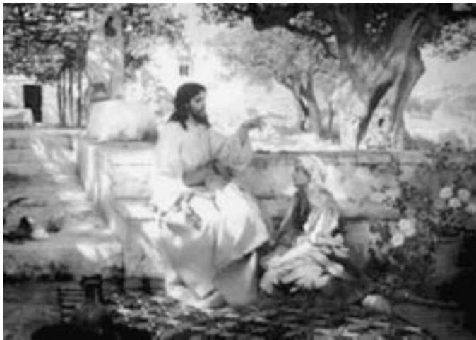
Dice Jesús “¿Y tú, María, serás una buena sierva de tu Señor?”

merecedor del milagro, merecedor de que se te hubiera tomado por instrumento de la glorificación de Dios en su Hijo. No tienen ellos la deuda de amor para con Dios... Puedo decirlo, puedo pedirlo de ti, y como primera cosa te pido que no guardes rencor contra los que te ofendieron y me han ofendido. Perdona, perdona, Lázaro. Fuiste sumergido en las llamas del amor. Debes ser «amor», para que no tengas otra cosa más que el abrazo de Dios.