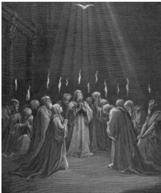
Sobre los apóstoles se posaron “unas lenguas como de fuego”, quedaron todos “llenos del Espíritu Santo...”

Estos primeros creyentes formaron una comunidad de intenso apoyo mutuo; vendían sus pertenencias y, para su sustento, hacían uso común lo que al venderlas percibían, en tanto que sus líderes se dedicaban en cuerpo y alma