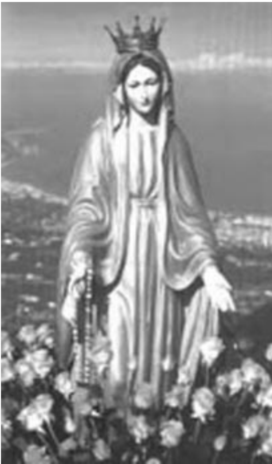
Nuestra Señora de la Reconciliación y de la Paz

de 1949, debió afrontar la mofa y la desconfianza de muchos y sobre todo debió atenerse a aquello que le impartía el Obispo. Le fue prohibido acercarse al monte Croce, pero la Señora inició sus apariciones en su propia casa. En todos aquellos años la Señora pidió mucho por la plegaria, la conversión, de tener mucha fe y hacer mucha penitencia por la conversión de los pecadores.