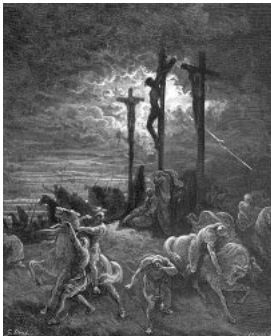
Crucifixión y muerte de Jesús

Jesús murió en medio de una oscura trama de equívocos humanos. Es cierto. Pero su muerte tenía propósitos que trascendían el límite de esa historia terrenal en cumplimiento de los propósitos establecidos por Dios para la humanidad entera. ¡He ahí el meollo de su muerte sacrificial! En la cena de la noche anterior había dicho: «Esto es mi sangre del pacto, que es derramada por muchos para el perdón de pecados» (Mateo 26.28). Jesús vivió en función de los demás y murió en coherencia con ese mismo destino. Se entregó en la cruz y lo hizo para que todos tuviéramos perdón de pecados; esa fue una entrega consecuente con su vida de servicio. Nada de absurdo había en