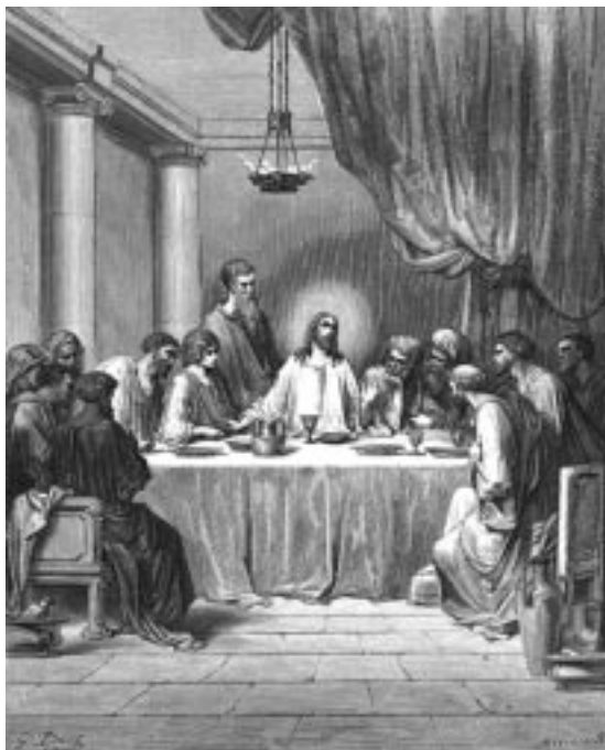
Jesús en la Cena Pascual con los apóstoles instituye la Santa Eucaristía.

cintura, luego echó agua en un recipiente y comenzó a lavar los pies de sus discípulos. Pedro fue el primero en sorprenderse, y hasta se opuso. ¿Cómo era posible que el Maestro se vistiera como un esclavo y quisiera lavarles los pies a sus seguidores? ¿Acaso no había declarado ser el Hijo de Dios y estar revestido de todo poder? ¿Cuál no sería la desilusión de los discípulos! Lo que ellos querían era ver a Jesús haciendo demostraciones de poder y de superioridad, sobre todo ahora que la muerte los amenazaba. ¡Pero no!, ahí estaba él vestido como un esclavo y dispuesto a inclinarse hasta el suelo para lavarles los pies.