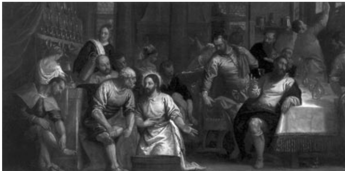
Jesús lava los pies a los apóstoles antes de la Cena Pascual

Cuando todo estuvo preparado Jesús se quitó el manto que vestía y se ató una toalla a la