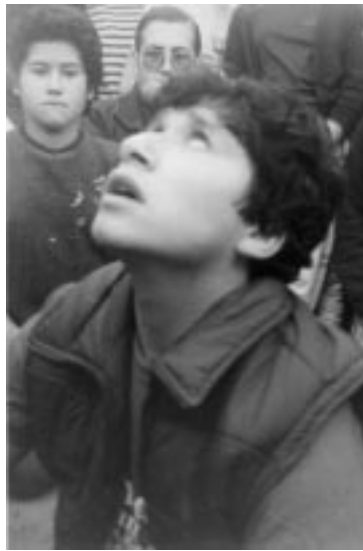
Miguel Ángel en éxtasis, Ocoa.

EL ABORTO ES UN PECADO MÁS. QUIEN TOME PÍLDORAS ANTICONCEPTIVAS ESTÁ PECANDO. LOS SACERDOTES ESTÁN PECANDO. QUIEN DEJA MATAR A UNA CRIATURA, ESTÁ PECANDO. DIOS HIZO AL HOMBRE Y A LA