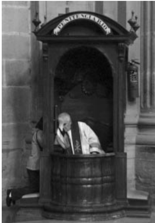
Dios le ha dado al sacerdote el poder de entregar Su Perdón al pecador arrepentido

Acude a él tranquilo, no temas decirle las cosas con toda