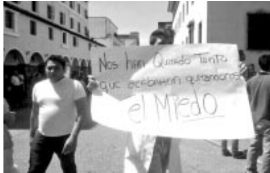
Jóvenes manifestantes en Venezuela

“El 12 de febrero, cuando se fueron mis muchachos solos a la concentración, estaban particularmente emocionados. Con sus dos botellitas de agua, un celular para comunicarnos y tomar fotos, la cédula en el bolsillo y la gracia de Dios. Era todo lo que llevaban”, recordó.