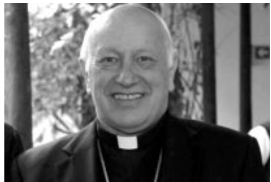
Monseñor Ricardo Ezzati.

En declaraciones a Radio Vaticano, el prelado dijo que se siente "confiado, en las manos de Dios, sintiéndome servidor de la Iglesia de una manera muy particular en esa porción que el Señor me ha confiado en la arquidiócesis de Santiago", contento además porque en adelante podrá ayudar al Papa "en