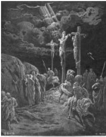
Jesús es crucificado en el Gólgota.

(Magdalena ha permanecido firme frente a la Cruz donde muere Jesús. Ha ayudado a su Madre ha sostener su cuerpo cuando lo bajan de la Cruz y una vez que Jesús es puesto en el sepulcro, se reti-