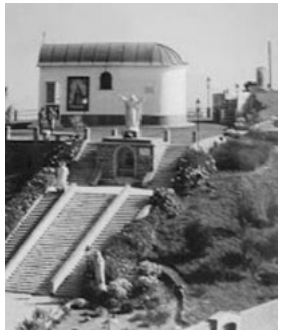
Santuario sobre el monte Croce

Desde 1971 los peregrinos han invadido Balestrino transformándose en una meta del peregrinaje europeo. La afluencia ha tenido una fuerte alza por varias vicisitudes. El Santuario será pronto objeto de modificaciones estructu-