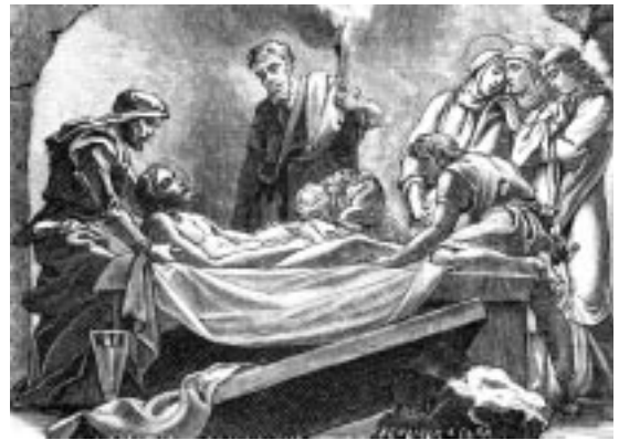
Jesús es sepultado en tumba de José de Arimatea.