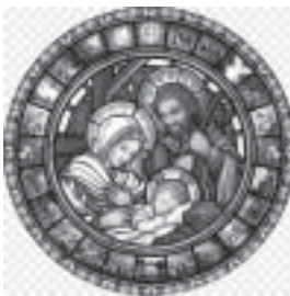
Natividad de Nuestro Señor Jesucristo