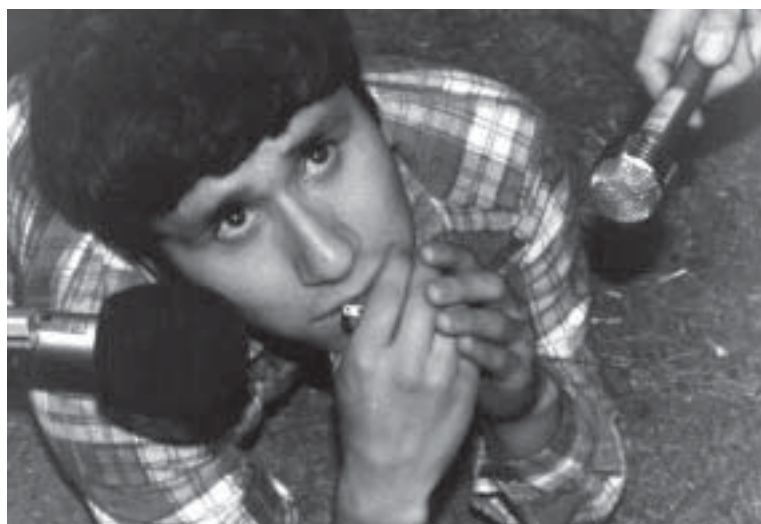
Miguel Ángel en éxtasis durante las apariciones

mos pies; porque Dios nos dio algo para caminar y comunicarnos y que sea sinceramente. Ella nos une y quiere venir a salvar almas y no hacer un show. Sino a salvar almas que van a la perdición.