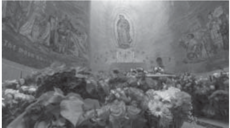
Una señal fascinante más en esta imagen-mensaje que impacta a los estudiosos y deja a los católicos maravillados desde hace 500 años