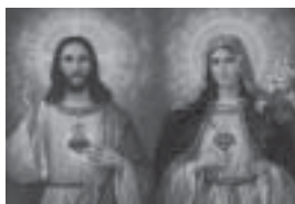
Sagrados Corazones de Jesús y María