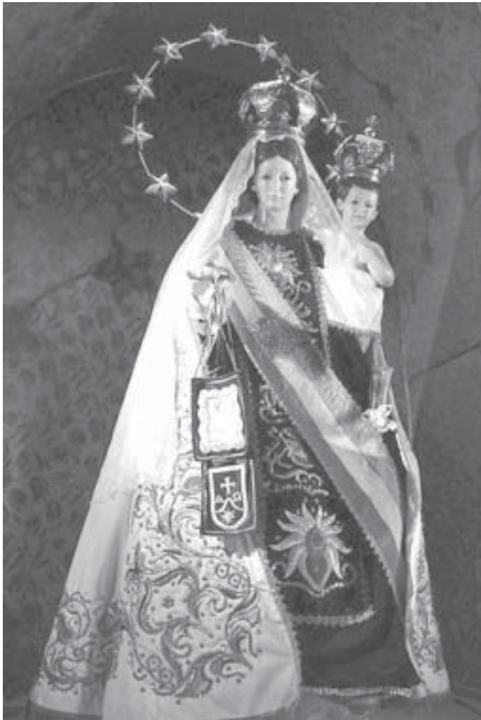
Imagen de la Virgen del Carmen de La Tirana

Ya en el siglo VI había allí un pequeño monasterio.