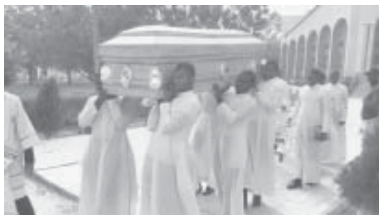
Funeral católico en Nigeria

Según Repinti, contra los cristianos nigerianos se ha “desatado una violenta locura terrorista de matriz tanto religiosa como político-económica, que busca deshacerse de ellos por X razones hasta que hayan desaparecido todos o queden todavía un número de ellos cuantitativa y cualitativamente pequeño”.