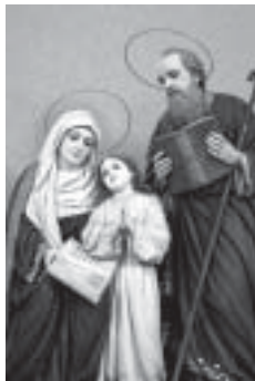
Santa Ana y San Joaquín, padres de María Santísima y abuelos de Nuestro Señor Jesucristo