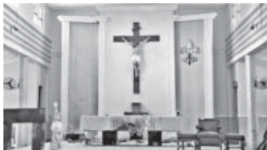
Parroquia de San Francisco Xavier tras la masacre del 15 de Junio

Explicó que al inicio pensó que “era un portazo o que alguien se había caído o había visto una serpiente, como ya había ocurrido en alguna ocasión”, pero luego dijo que oyó “un segundo ruido fuerte y vi a los feligreses corriendo en diferentes direcciones en la iglesia”.