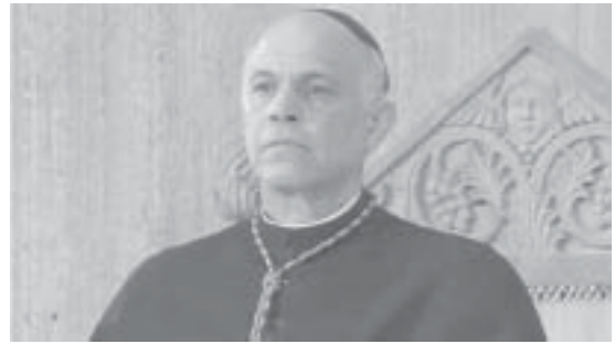
Mons. Salvatore Cordileone, Arzobispo de San Francisco (Estados Unidos)

Ese día, el Santo Padre dijo que “todo niño no nacido, pero condenado injustamente a ser abortado, tiene el rostro de Jesucristo, tiene el rostro del Señor, que antes incluso de nacer y luego apenas nacido ha experimentado el rechazo del mundo”.