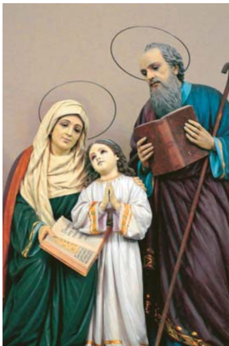
San Joaquín y Santa Ana rogad por nosotros

INFORMATIVO DE LAS APARICIONES DE LA SANTISIMA VIRGEN EN EL MONTE CARMELO, PEÑABLANCA - CHILE