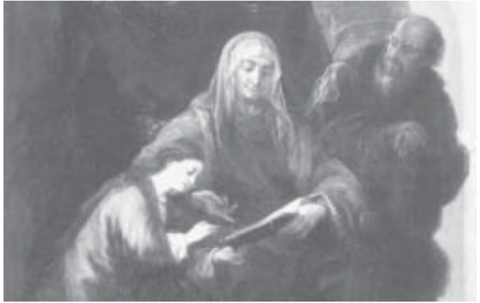
Santa Ana y San Joaquín enseñan a leer a la Santísima Virgen

Fueron unidos en matrimonio en un pequeño lugar donde había una pequeña escuela; sólo un sacerdote asistió al acto. Los casamientos eran entonces muy sencillos, los pretendientes se mostraban en general apocados, se hablaban y no pensaban en otra cosa sino que así debía ser. Decía la novia "sí" y quedaban los padres conformes; decía, en cambio, "no", teniendo sus razones y también quedaban los padres de acuerdo. Primeramente eran los padres quienes arreglaban el asunto, a esto seguía la conversación en la sinagoga. Los sacerdotes rezaban en el lugar sagrado con los rollos de la ley y los parientes en el lugar acostumbrado. Los novios se hablaban en un lugar aparte sobre las condiciones y sus inten-