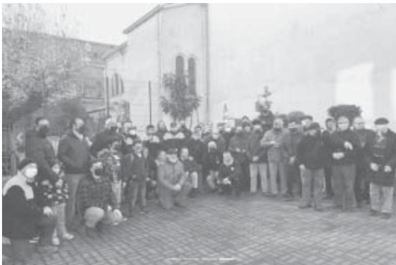
Un grupo de varones se reunió la mañana del sábado 11 de junio para participar en el primer Rosario de Hombres realizado en Concepción.

El Rosario de Hombres es una iniciativa que nació en Polonia e Irlanda en 2018 y que poco a poco se ha extendido por diferentes