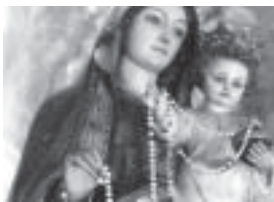
Nuestra Señora del Rosario