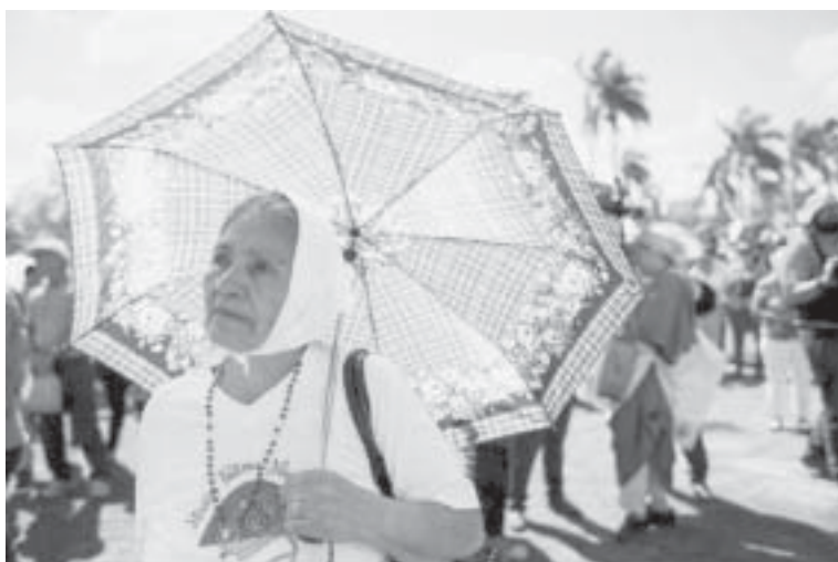
Una mujer participa en una misa en honor a la Virgen de Fátima en la Catedral Metropolitana de Managua, Nicaragua

El apoyo de la Iglesia a los manifestantes fue visible en varias ocasiones, por ejemplo, cuando en abril de 2018 la catedral de Managua sirvió de refugio a los manifestantes y ayudó a recaudar dinero y víveres para apoyarlos.