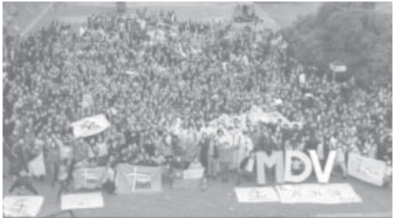
Mil quinientos jóvenes de Chile saliendo de misión desde la Pontificia Universidad Católica de Chile (UC).

“Testimonien con autenticidad y coherencia nuestro ser creyentes. Son tres verbos que enriquecen la vida de la Iglesia, le dan un rostro joven y vital a esta Iglesia llagada y a