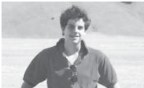
Beato Carlo Acutis

10. “La felicidad es mirar hacia Dios, la tristeza es mirar hacia uno mismo”.