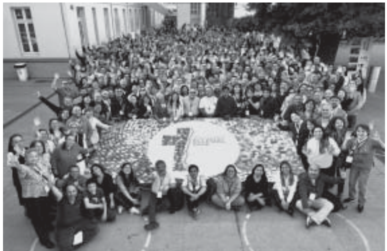
Asistentes a la Ceremonia de clausura de la III Asamblea Eclesial Nacional

Durante la Asamblea, los participantes distribuidos en 60 comunidades pudieron discernir a partir de los temas que surgieron con fuerza en los informes diocesanos para el Sínodo de la sinodalidad convocado por el Papa Francisco y que permitieron profundizar en el