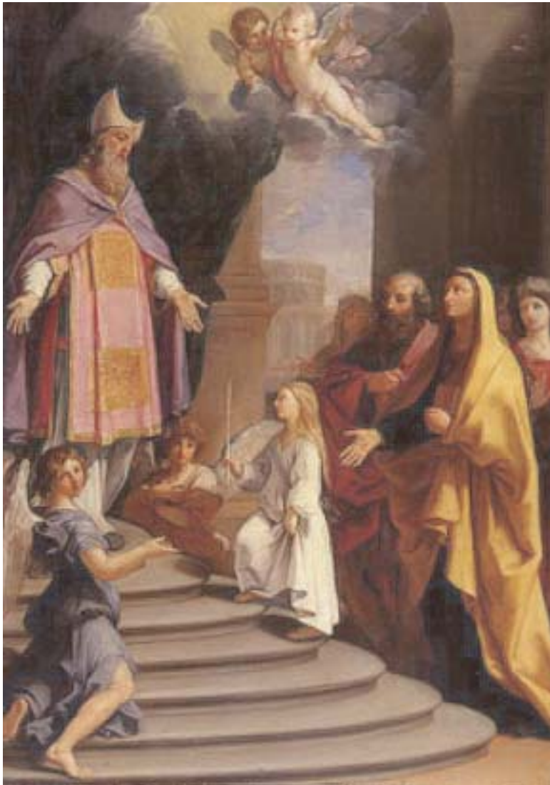
Presentación de la Santísima Virgen al templo

INFORMATIVO DE LAS APARICIONES DE LA SANTISIMA VIRGEN EN EL MONTE CARMELO, PEÑABLANCA - CHILE