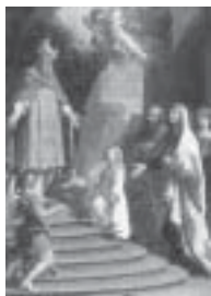
Presentación de la Santísima Virgen al templo