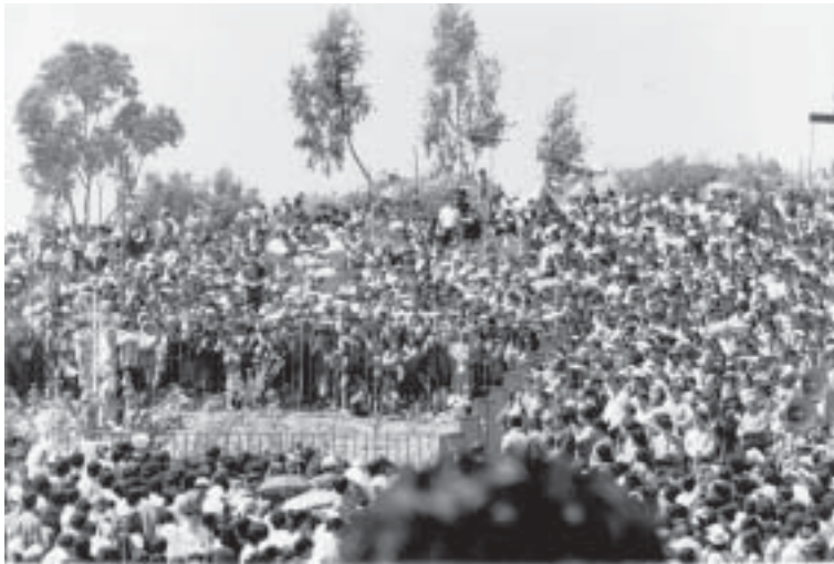
Varios centenares de fieles en la aparición de 7 de octubre de 1983