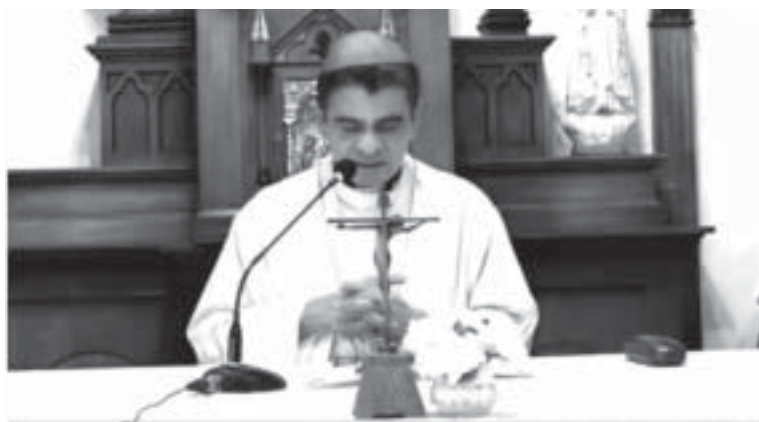
Monseñor Rolando Álvarez en Misa transmitida el 18 de agosto desde la casa episcopal de Matagalpa.

después, la Policía Nacional reveló que el Prelado fue llevado a Managua, a casi tres horas en auto de Matagalpa, donde permanece bajo “resguardo domiciliario”. Los sacerdotes, seminaristas y el laico que lo acompañaban fueron trasladados a la “Dirección de Auxilio Judicial”, un reclusorio conocido como un lugar de torturas para opositores de la dictadura, conocido también como “El Chipote”.