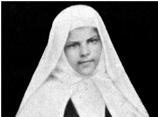
Santa María de Jesús Crucificado (Mariam)

hubo disimulo, sino también falta a su voto de pobreza, de desprendimiento total, ¡Y también