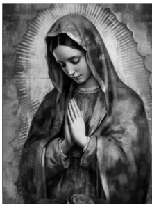
Nuestra Señora de Guadalupe