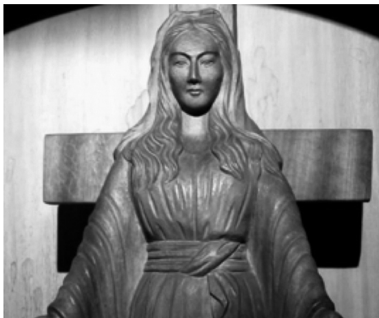
Nuestra Señora de Akita

izquierda, que le sangraba y no podía tomar la comunión en la mano.