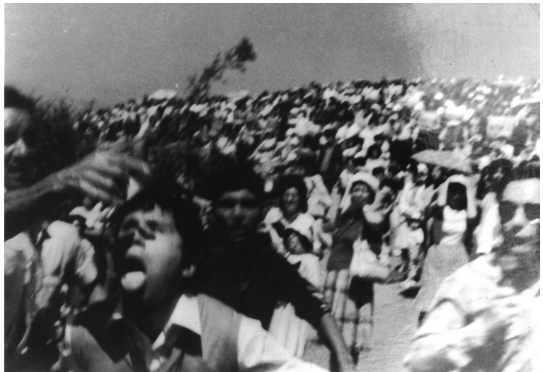
El vidente, Miguel Ángel, con la Sagrada Forma en su boca se desliza en medio de los atónitos fieles.

grinos, ya más interiorizados de los avisos de nuevas apariciones, aumenta. Algo va a suceder el Domingo.