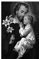
San José y Niño Jesús