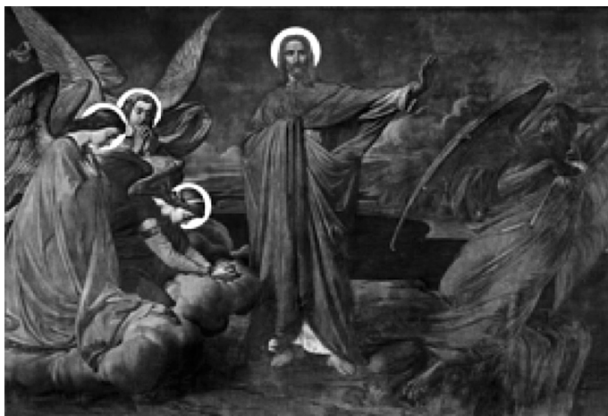
El demonio huye de Cristo tras fracasar en su tentación (Jan Swerts - s.XIX)

En nuestros días hay quien se permite el lujo de negar la existencia del demonio. Explican