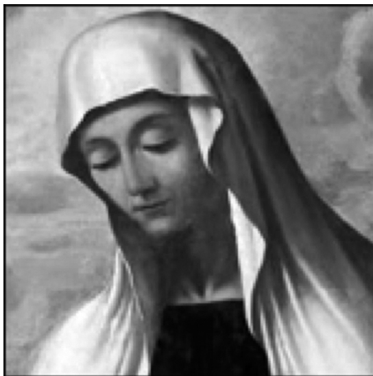
Santa Francisca Romana

La guerra tocó de cerca también a Francisca pues hirieron al marido y, al único hijo que le quedaba, se lo llevaron como rehén. Todas