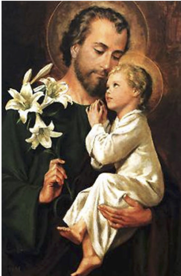
"San José ruega por nosotros"

INFORMATIVO DE LAS APARICIONES DE LA SANTISIMA VIRGEN EN EL MONTE CARMELO, PEÑABLANCA - CHILE