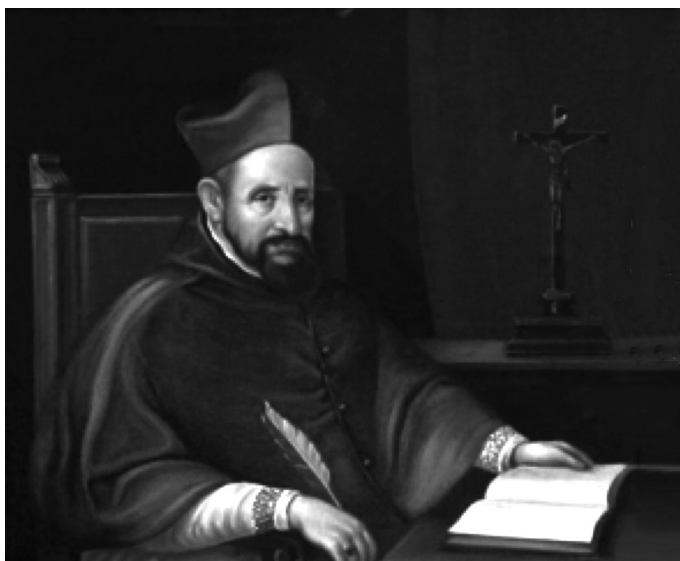
San Roberto Belarmino

Creo que no hay duda de que este gran santo y doctor de la Iglesia tenía toda la razón: si no nos preocupamos por prepararnos para morir bien y santamente es porque somos unos necios, porque no entendemos lo que nos conviene de verdad. Nos entrenamos durante semanas o meses o años para un examen, una oposición, una entrevista de trabajo o una competición y, en cambio, si acaso pensamos un instante en la muerte, es para desear que nos encuentre dormidos y no nos enteremos de nada. Aparentemente, morir en gracia y como Dios quiere, arrepentidos de nuestros pecados, es la menor de las preocupaciones de la gran mayoría de