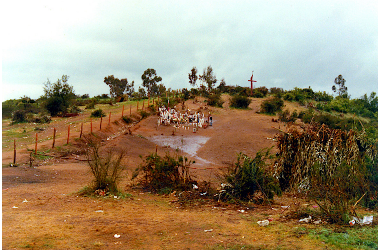
Parte del cerro de Peñablanca donde ocurrieron las primeras apariciones (fotografía: 14 de septiembre de 1983).