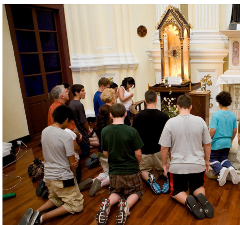
Reunión familiar para rezar el Santo Rosario

Pero a la vez Él no nos niega su ayuda. A lo