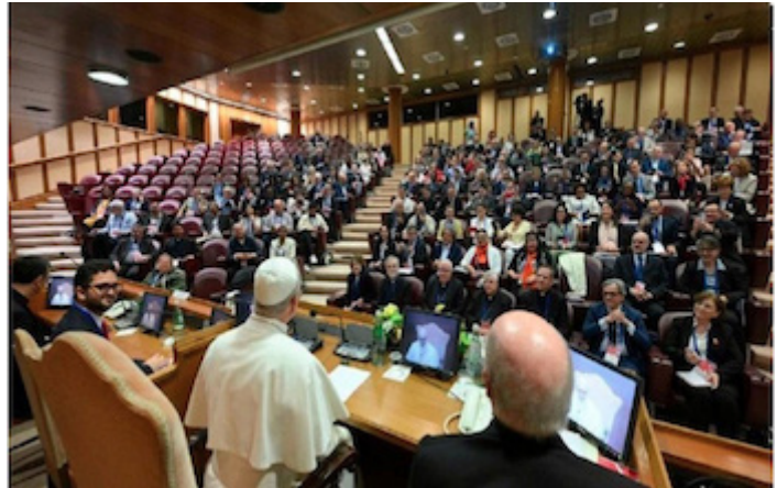
El Papa León XIV se dirige a unos 200 líderes de movimientos eclesiales y nuevas comunidades