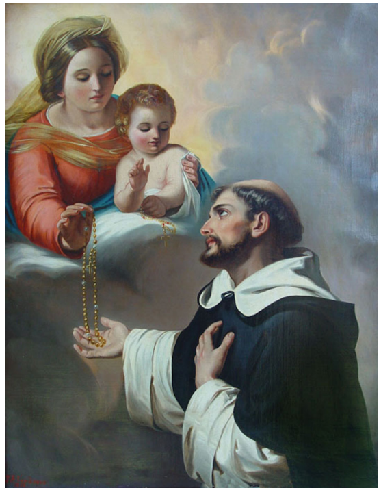
La Santísima Virgen entrega el santo Rosario a santo Domingo de Guzmán.

Siguiendo esta tradición, las mujeres cristianas que eran llevadas al martirio por los romanos, marchaban por el Coliseo vestidas con sus ropas más vistosas y con sus cabezas adornadas de coronas de rosas, como símbolo de