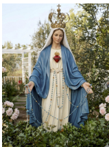
Nuestra Señora del Rosario